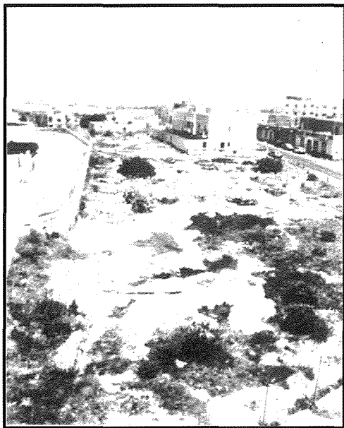
Il-cart ruts li jinsabu f'Tal-Minsija li sfortunatament għadew f'idejn il-Kunsill Lokali ta' San Gwann riċentament.

San Ġiljan huwa raħal magħruf mad-divertiment u l-lukandi. Mħuwieħ raħal assoċjat ma' fdalijiet storiċi li jmorru lura sew fiż-żmien. Sal-1800 f'dawn l-inħawi ma kien hawn xejn għajr Palazzo Spinola, il-Kappella tal-Kunċizzjoni, il-Knisja ta' San Ġiljan Ospitalier magħrufa popolarment bħala "Ta' Lapsi" u erba' griebeg ta' sajjieda u bdiewa imferrxin 'l hemm u 'l hawn. Dari, dawn l-inħawi ma tantx kienu mfittxija minkejja l-għmiel tan-natura li kien hawn speċjalment b'Wied Ghomor.