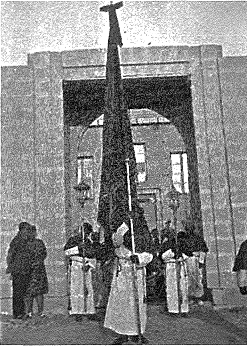
Il-purċissjoni hierġa mill-knisja l-ġdida li għadha mhix lesta

s-salib kien jintrefa' mis-sagrigan. Tajjeb li nsemmu li fi żmien il-Kappillan Dun Tarcis, is-sagrigan kien impjegat full time , u dan il-post kien jintiret mill-istess membri tal-familja, sakemm il-Kappillan ma setax iħallas iżjed, minħabba li kien qed jahseb għall-bini ta' knisja ġdida. Wara l-fratelli, kien ikun hemm l-abbatini, il-kleru u fl-aħħar nett, iċ-ċelebrant iżomm ir-relikwa ta' Sant' Anna. Meta beda x-xogħol fuq il-knisja l-ġdida fl-1953, il-festa, il-purċissjoni u n-nar bdew isiru b'inqas pompa u l-flus li jiffrankaw kienu jmorru b'risq il-bini tal-knisja.