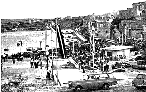
Il-festa ta' Sant'Anna fl-imghoddi

Hekk kif deher li kienet se tispiċċa l-gwerra f'Malta, il-ftit familji li fl-1943, kienu baqgħu joqogħdu Wied il-Għajn, bil-mod il-mod, setgħu jerggħu jibdwew jgħixu ħajja normali, jippruvaw jinsew in-niket u l-faqar li ħalliet warajha l-gwerra u jħarsu 'l quddiem lejn il-gejjieni b'mod pożittiv. Xi residenti li twieldu u trabbew f'Wied il-Għajn, kif ukoll xi kanonċi mill-Parroċċa tal-Isla li kienu residenti għas-sajf (u li dak iż-żmien kienu responsabbli mill-funzjonijiet religjużi fil-knisja l-qadima ta' Triq La Sengle), hasbu biex jorganizzaw festa ddedikata lill-Patruna ta' dan ir-raħal żgħir, imma wisq helu - lil Sant'Anna Omm Marija Bambina.