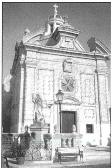
Il-Kappella ddedikata lil Santa Marija f'Hal Muxi, fil-periferija ta' Haż-Żebbuġ u li nbriet fl-1775.

sema jew ahjar kif jafuha hafna "Ta' Mamo".