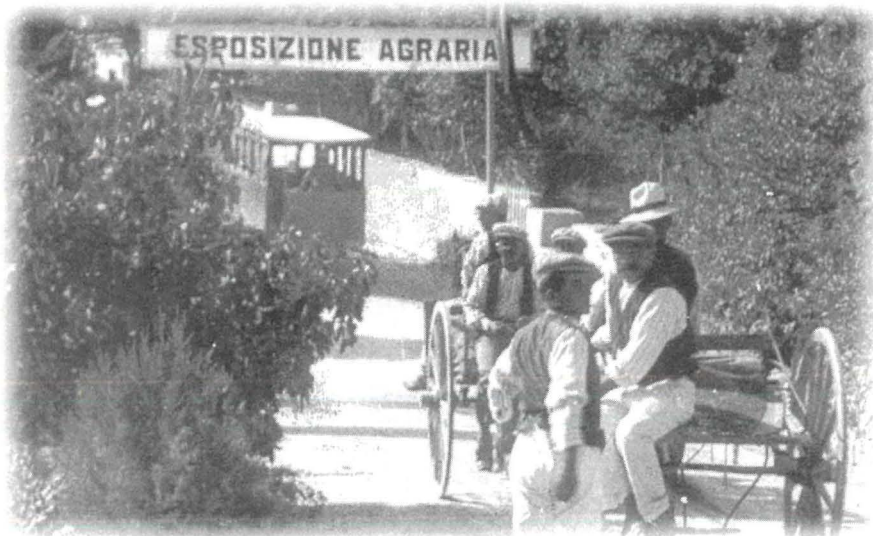
Xena tipika tas-seklu dsatax, raħħala sejrjn għall-wirja agrarja ta' l-Imnarja fil-Buskett, post magħruf hafna għall-ghana.

Ċkejken wisq id-daħk tal-faraġ, Żghira il-hena, żghir il-ferh,