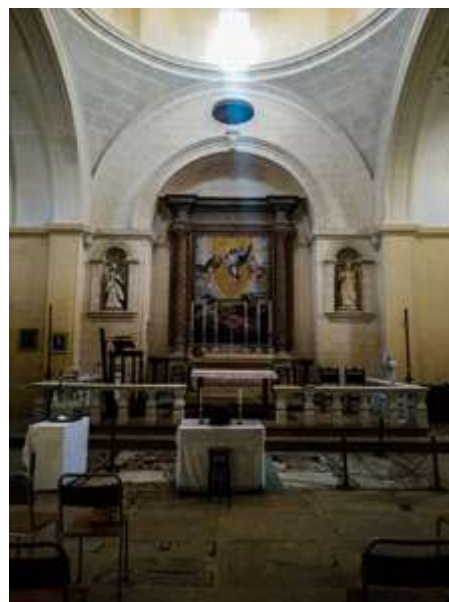
Perspettiva tal-artal ewleni tal-knisja tas-Salvatur, Parroċċa l-qadima ta' Ғal-Lija

knisja parrokkjali. Kienet tikkonsisti biss mill-korsija u wara żdiedu żewġ kappelluni u b'hekk il-knisja Ғadet il-forma tal-ittra T. Meta żarha l-Isqof Cagliares fl-1615 qal li kienu għadhom kemm żiedu mal-kappelluni koppla baxxa u din flimkien ma' dik tal-knisja qadima ta' Santa Katerina taż-Żejtun huma l-ewwel żewġ koppli li nbnew f'pajjiżna. Kienet Ғaġa sewwa li meta l-poplu ta' Ғal Lija fl-añhar tas-seklu sbatax bdew jibnu knisja akbar, għażlu post ieñor flok li waqqgħu l-qadima u b'hekk sal-lum għadna ngawdu l-knisja tas-Salvatur il-Qadim.