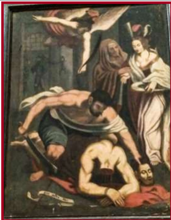
KNISJA TAS-SALVATUR Hal-Lija, Parroċċa l-qadima