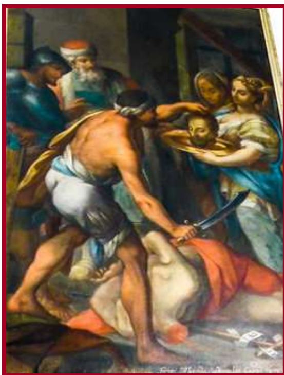
KAPPELLA SANTA KATARINA Monasterju tas-Sorrijiet Agostinjani, Valletta