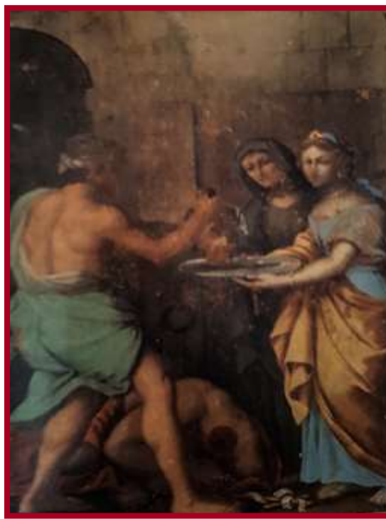
KAPPELLA SANTA MARIJA Haż-Żebbuġ (Ta' Mamo)