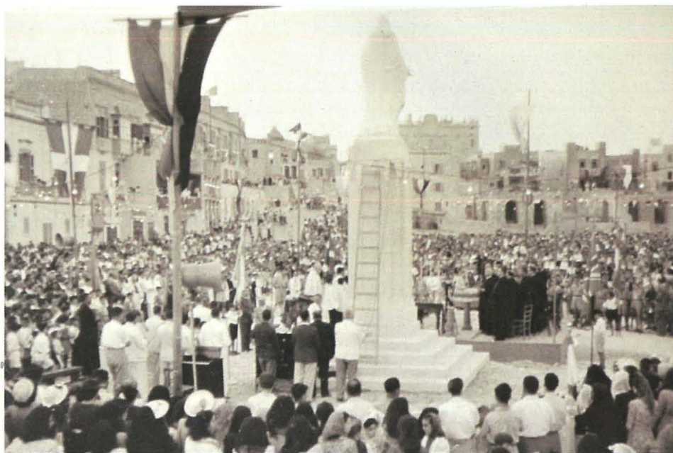
L-4 ta' Lulju 1948 - It-tberik tal-istatwa tal-Qalb ta' Ġesù

ħdeġha peress li kienu meqjus abħala l-aħjar trasport ta' dak iż-żmien, fejn l-aqwa kljenti tagħhom kienu dawk is-soldati stazzjonati fil-barracks ta' Sant'Andru u San Patrizju. Attivita' matul il-ġurnata sa x'hin taqa' d-dalma ftit li