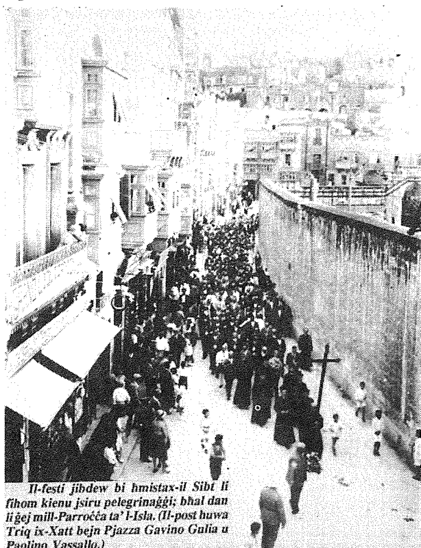
Il-festi jibdw bi hmistax-il Sibt li fihom kienu jsiru pelegrinaġġi; bhal dan li ġej mill-Parroċċa ta' l-Isla. (Il-post huwa Triq ix-Xatt bejn Pjazza Gavino Gulia u Paolino Vassallo.)