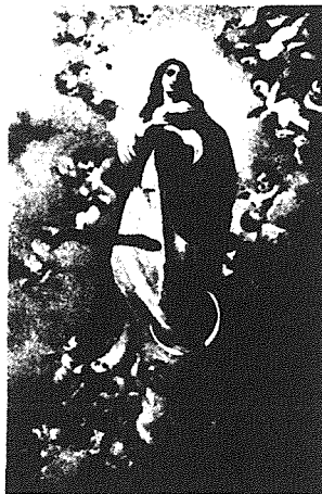
O Mary, conceived without sin, pray for us, who have recourse to Thee.