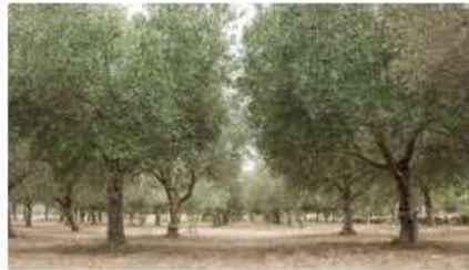
Masġar b'siġar taż-żebbuġ stabbiliti ta' madwar 15-il sena

F'Malta hawn diversi varjetajiet ta' siġar taż-żebbuġ li jiġu mkabbra għall-għasir. Uħud minn dawn huma l-Frantoio, iċ-Cipressino, il-Pendolino, il-Leccino, Tal-Bidni, l-Ogliarola, il-Biancolilla, l-Ottobratica, in-Nolca u l-Pasola. Hawn varjetajiet oħrajn li appartu li jintgħasru għaž-zejt, jistgħu wkoll jintużaw bħala żebbuġ tal-mejda. Ftit minn dawn il-varjetajiet huma l-Carolea,