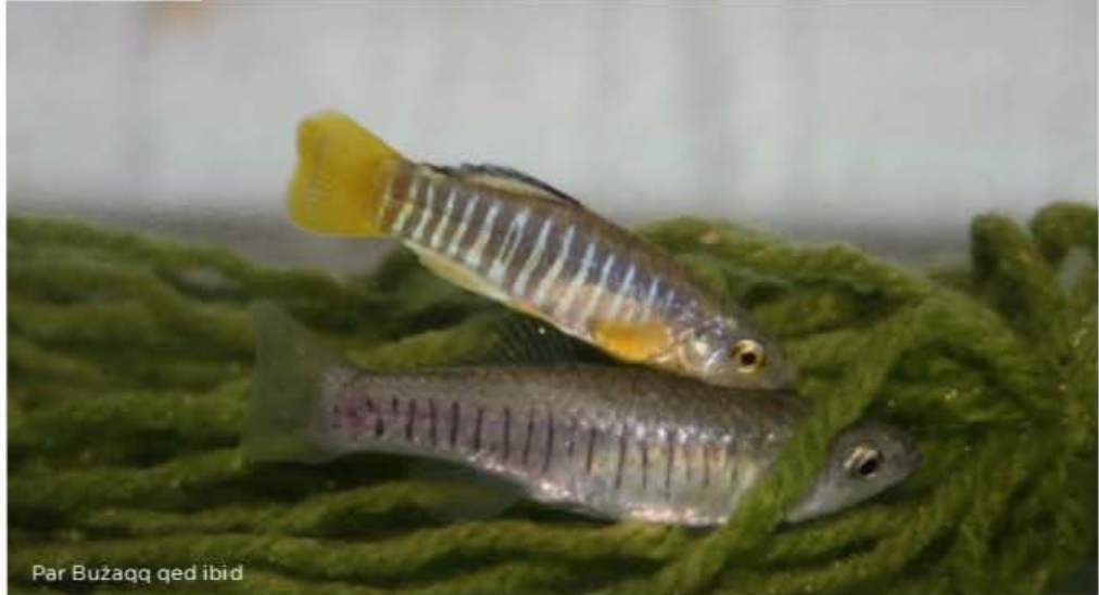
Par Bużaqq qed ibid

pari Bużaqq biex permezz tagħhom jibda x-xogħol ta' tkattir b'metodi xjentifiċi. Riżultat ta' dan, is-sena li għaddiet ġiet irrilaxxata fis-sit tal-Magħluq l-ewwel qatgħa ta' Bużaqq imkabbra mill-KCP bħala prova, wara li dawn kienu qattgħu żmien kemxejn twil f'gagġa fil-post fejn setgħu jiġu osservati kuljum minn uffiċjal tal-akkwakultura qabel intelqu definittivament fis-sit.