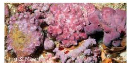
Fig 3: Maerl