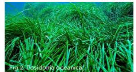
Fig 2: Posidonia oceanica