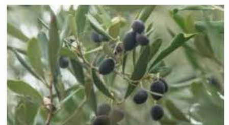
Żebbuġ misjur lest għall-qtuġ u għall-għasir