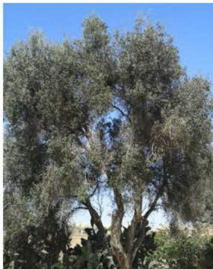
Siġra taż-żebbuġ matura

Dawn ir-riżultati inkoraġġanti ma jistgħux jiġu milfuqa mingħajr il-koperazzjoni tal-bdiewa u tal-għassara. Din il-koperazzjoni wasslet sabiex id-Direttorat tal-Agrikoltura jkun jista' jissalvagwardja t-traċċabilità tal-produzzjoni taż-zejt taż-żebbuġa u jsaħħaħ dan is-settur sabiex dan il-prodott lokali jkompli jkun l-għažla naturali tal-konsumatur Malti.