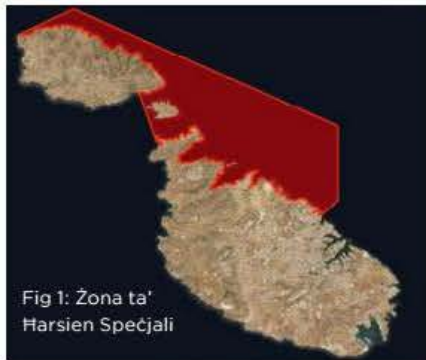
Fig 1: Żona ta' Harsien Speċjali

Assistant Manager (Dipartiment tas-Sajd u Akkwakultura) u Alumnus tal-Kulleġġ Malti tal-Arti, Xjenza u Teknoloġija