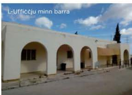
L-Uffiċċju minn barra

Għal aktar informazzjoni rrikorru għall-uffiċċju tal-ARPA fil-Pitkalija ta' Ta' Qali jew ċemplu fuq 22 92 61 48 jew 22 92 61 63. Tistgħu wkoll tibagħtu email fuq arpa.mafa@gov.mt .