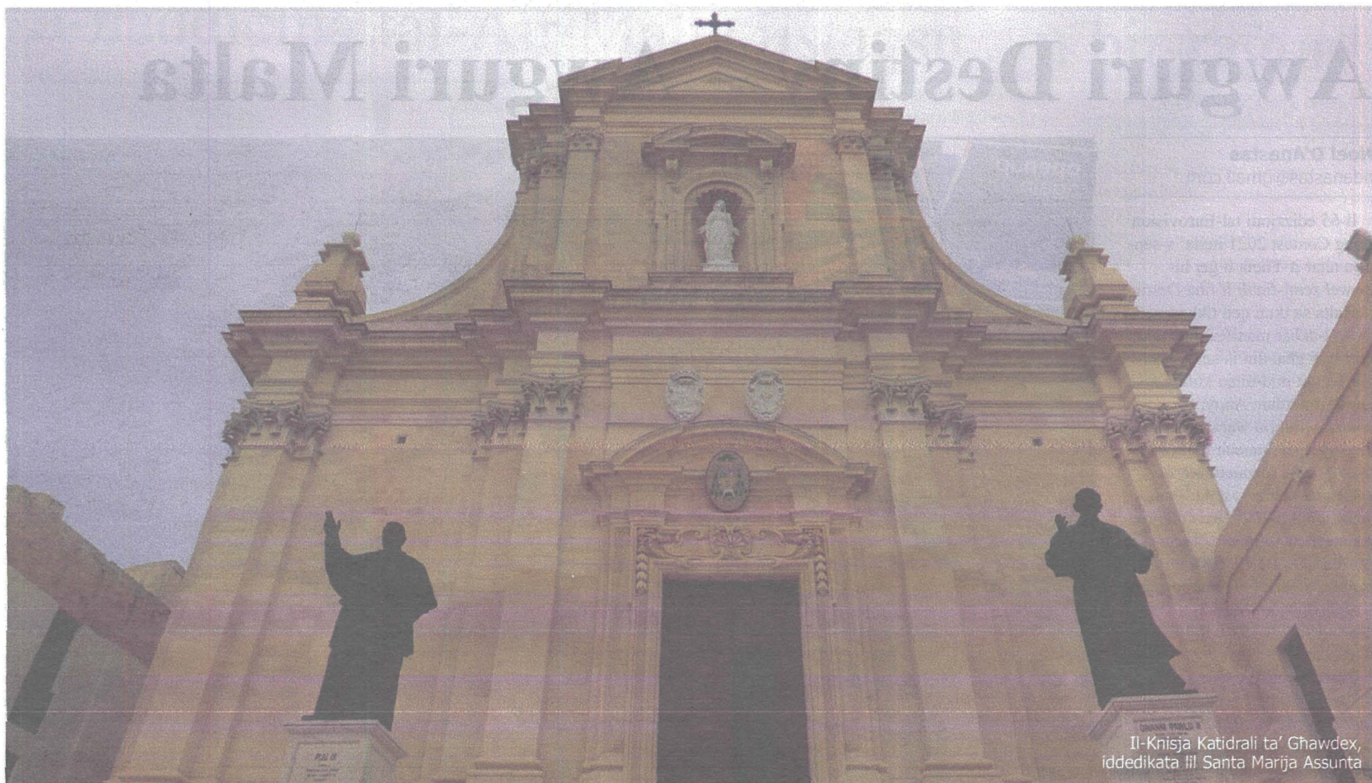
Il-Knisja Katidrali ta' Għawdex, iddedikata lil Santa Marija Assunta