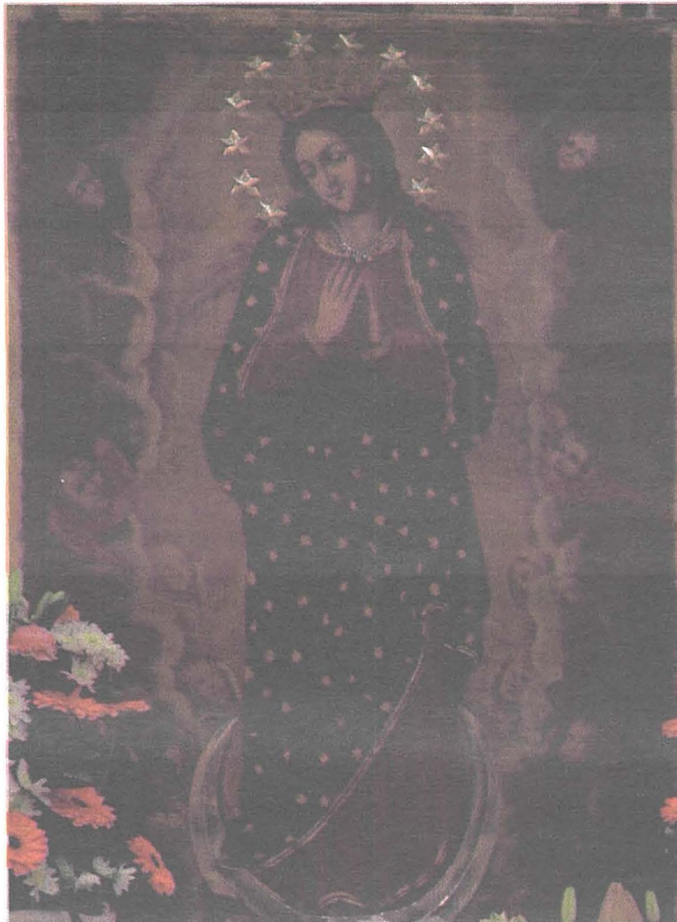
Il-Kwadru antik u devot ta' Santa Marija, magħruf bħala "tal-Kuncizzjoni", meqjum fil-Knisja Matriċi u Arcipretali taż-Żebbuġ, Għawdex.

Xi awturi sejhju lil Għawdex bħala 'l-Gżira tal-Madonna' għaliex hija mfawra bi knejjes u niċċ dedikati lilha.