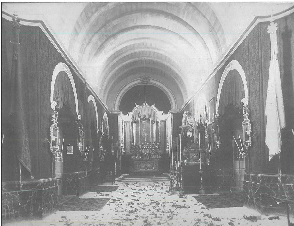
Dan ir-ritratt tal-Knisja ta' Lapsi armata għall-festa jmur lura aktar mill-1900, billi s-saqaf jidher għadu mhux impitter u għad m'hemmx in-niċċ ta' l-istatwi.

It-8 ta' Settembru fl-1906 ħabat is-Sibt u dakinhar insibuh imħabbar fil-gazzetta The Malta Herald li l-għada l-Hadd, disgħa tax-xahar, waranofsinar, fil-bajja ta' ġewwa (jigifieri ta' Spinola), xi residenti Ġiljanizi kienu ħadu l-brigu jorganizzaw minn buthom festa oħra. Il-programm kellu jkun varjat tassew u attraenti għax kellu jkun fih mhux biss il-banda, ir-regatta, u l-ġostra tas-soltu, imma ukoll għors shiħ fil-baħar li l-qofol tiegħu kellu jkun tellieqa fil-baħar wara ħanzira li tkun intelqet tghum; nistħajjel jien (għalkemm il-gazzetta ma tghidhiex) li l-palju kien jieħdu min kien jirnexxilu jaqbad il-povra ħanzira!