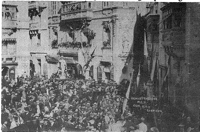
Piazza Paolino Vassallo fl-1911.

Fl-1655 Bormla kienet infettata flimkien ma' l-Isla, il-Birgu, il-Belt u Haż-Żabbar. Għalhekk dawn il-postijiet ingħalqu għal erbghin jum. Każ iehor li fih Bormla, flimkien ma' l-Isla, il-Birgu u l-Belt ingħalqu mill-ġdid