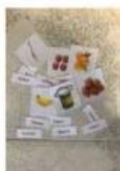
Eżempju ta' lehhiet