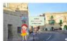
Parti mill-istorja Nieklu u Nivjaggaw ma' Frawlina