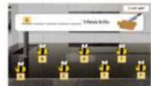
Attività mill-istorja Nieklu u Nivjaggaw ma' Frawlina permezz tal-Powerpoint