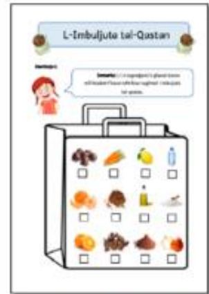
Eżempju ta' karta tat-taħriġ