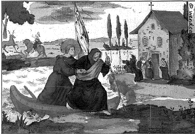
F'din il-pittura taħt l-isem Saint Julien le Pauvre, naraw lil San Ġiljan qiegħed iwieżen xwejjah biex joħroġ mid-dgħajsa wara li biha qasmu x-xmara.

Izda minħabba li hu ma kellux biex jgħin lil daqstant nies fil-bżonn, beda jmur iħabbat il-bibien tal-benestanti, fil-palazzi tas-sinjuri, u lilhom kien jitlob kull għajjnuna u sokkors f'għieħ l-imħabba ta' Alla u tal-umanità mġarrba. 4 Bis-saħħa t'hekk kien jirnexxilu jmiss il-qlub ta' xi wħud u jikseb il-koperazzjoni ta' oħrajn biex seta' jkompli jgħin mill-aħjar li jista' lil dawn il-ħafna fqajrin morda. Hadd minnhom, fil-fatt, ma rresista għall-kliem imhegġeġ ta' Ġiljan. Ilkoll ingħaqdu miegħu