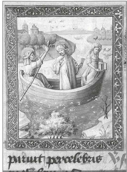
Immaġini li turi x-xena ta' San Ġiljan fuq id-dgħajsa tal-pellegrini.

Kulhadd kien jitkellem b'entużjażmu dwar dan il-bniedem singolari. Kienu jistqarru l-esperjenzi ta' ħlewwa li garrbu lkoll fl-ispirtu meta raw lil dan il-bniedem ta' Alla. Ir-rakkonti kienu jgħaddu minn fomm għall-ieħor, u ma kienet tieqaf qatt l-għajta tal-poplu dwar il-kobor u l-qdusija ta' dan il-bniedem. "O dan il-lukandier twajjeb! O dan l-Ospitalier ġeneruż! O kemm hu qaddis dan Ġiljan!" Hekk minn fomm għall-ieħor, mill-missier għall-