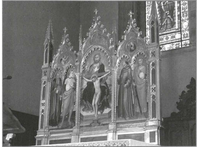
Dettall mill-kwadru ta' fuq l-artal il-maġġur, Basilica Santa Trinita, Firenze. San Ġiljan jidher fuq il-lemin.

F'Ruma fuq il-portiku tal-Knisja Nazzjonali tal-Fjammingi hemm statwa ta' San Ġiljan li qed iżomm seker f'idu bħala sinjal tal-kaċċa li tagħha bħala ġuvni kien diletant.