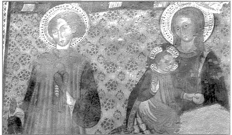
Pittura li tinsab fil-Knisja ta' San Giovanni f'Rocca San Zenone, Terni. Sa xi snin ilu l-qaddis li jidher fuq ix-xellug kienu jaħsbuħ San Bavone. Izda studji ikonografiċi li saru kkonfermaw li huwa San Ġiljan Ospitalier.

Mit-tifikiriet li baqa' nafu b'ċertezza li din il-koppja, fl-isem qaddis ta' Alla, wettqu vjaġġi twal u fattikużi; għaddew mill-muntanji Alpini, boskijiet imbiegħda, u widien fondi u niedja. Nafu li b'rassenjazzjoni shiħa, anzi b'ferħ u b'sens ta' radd il-ħajr lill-Mulej, issaportew ċaħdjet u diffikultajiet ta' kull ġeneru; ġuħ u għatx, shana u bard, u saħansitra