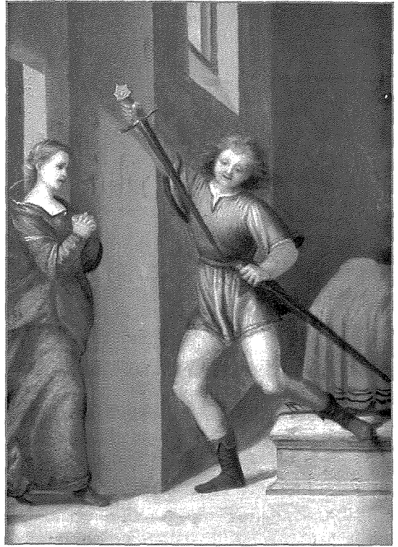
Pittura attribwita lil Franciabigio li turi lil San Ġiljan jiltaqa' ma' martu wara li kkommetta d-delitt doppju.

kienet riesqa lejh b'pass meqjus u dinjituż. Bilkemm ma bediex jagħrafha, mix-xeħta tagħha kien jafha x'imkien żgur. Jieqaf ħesrem, jimmira l-attenzjoni tiegħu fuqha, iħares lejha ċcassat, u mibluġħ għajjat: "Dik marti!" Jibbies, ma jiċcaqlaqx minn fejn kien, bil-kemm irid jemmen dak li kien qed jara b'għajnejh. Izda l-mara tkompli tersaq lejh, tmur dritt għal fuqu ferħana li qed tarah, u ssellimlu affettwożament, dehret ferħana wisq li kienet qed tergá' tarah lura magħha. Il-ħarsa t'għajnejha ddewbu u gib fih bidla. Jistaqsiha mistoqsija delikata. Ma twegħbux, mhux għax ma riditx imma ma kinitx taf minn fejn se tibda. Imbagħad jagħmel sforz u jistaqsiha b'aktar mod ċar min kienu dawk it-tnejn fis-sodda taż-żwieġ tagħhom. Il-mara twajba tiegħu tirrakkontalu l-istorja kollha bl-inġenwità tal-innoċenza tagħha u tassigurah li dawk il-barranin f'kamarthom ma kinux għajr il-ġenituri tiegħu, li hi stess kienet tathom is-sodda tagħhom b'kumpliment u b'unur speċjali. "Ejja għaziż tiegħi," ikkonkludiet il-mara tiegħu, "ejja halli tgħannaq miegħek lill-maħbubin ġenituri tiegħek u tgawdi minn din il-konsolazzjoni mhux mistennija li fil-kobor bla qies ta' tjubitu għoġbu jibgħatlek il-Mulej tagħna.