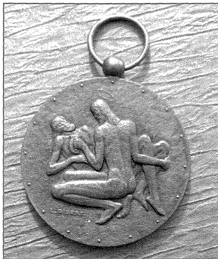
Midalja antika ta' San Ġiljan Ospitalier iffirmata Gibert SS-273.

Irrispettivament mill-identità tal-post, nafu xorta waħda li Ġiljan tagħna ddedika ruħu interament biex jagħti l-għajjuna tiegħu lil bosta aħwa li riedu jaqsmu din ix-xmara perikoluża għal diversi bżonnijiet li kien ikollhom iwettqu n-naħa l-oħra, u dari, ħafna minnhom, kif diġà għidna kienu jew jitolfu ħajjithom, jew jekk jirnexxilhom jaqsmu kienu jaslu n-naħa l-oħra fi stat tal-biki. Lejl u nhar, f'kull ħin u kull mument huwa kien dejjem lest biex bid-dgħajsa tiegħu jgorr passigġiera ta' kull kundizzjoni: izda ħafna minnhom kienu jkunu fqar, xjuħ, nisa mċerċra u tfal mitlufa, li biex jiksbu l-għajxien tagħhom ta' kuljum kienu jeħtieġu li jaqsmu 'l hemm u 'l hawn minn din ix-xmara. Dawn kollha, li kieku ma kienx għal San Ġiljan, kien ikollhom jipperikolaw saħħithom u saħansitra ħajjithom fuq din ix-xmara. Ma nistagħbux għalhekk li dawn in-nies fqajra kienu jipprovaw juru r-rikkonoxximent tagħhom lejn dan il-benefattur b'diversi modi, u ma nistagħbux lanqas li kienu jsejhulu "anglu tal-karità" mibgħut mis-sema biex isabbarhom u jehlishom minn tant diffikultajiet.