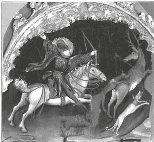
Le due vite di San Giuliano l'Ospitaliere, pittura li tinsab fil-Pinacoteca, Cagliari.

Ma setax ikun aktar kuntent. Kien kuntent, anzi ferħan, u sodisfatt għall-aħħar għax kien issielet u għaraq l-għaraq tad-dem, biex ngħidu hekk, kważi spalla ma' spalla mal-Prinċep.