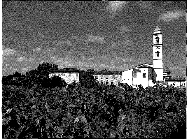
Il-Kunvent u l-Knisja ta' Santa Marija f'Ripa (Empoli).

Fil-ghodwa tat-8 ta' Awwissu 186. (?) 1 raġel li kellu statura għolja, ta' xehta serja, u li jagħtik x'tifhem li fiż-żmien kien sabiħ u maestuż, daħal fil-Knisja ta' Santa Marija ta' Ripa, jew Empoli Vecchio, 2 immexxija mill-Patrijiet Frangiskani Osservanti (li llum insejħulhom Minuri - bħal Ta' Ġiezu, biex niftiehm). Mid-dehra tiegħu kien jidher li kien raġel qaddis, fundament mitluf f'dak il-ġmiel maestuż ta' dak it-tempju qaddis, u minkejja l-ħamsin sena li kellu, kien qisu għadu fl-aqwa ta' żgħożitu. Waqaf wara li għamel ftit passi 'l ġewwa mill-bieb, u qagħad hemmhekk josserva b'mod kurjuż, u fi ftit ħin ta daqqa t'għajn il-knisja kollha, imbagħad beda miexi biex jara fid-dettall il-partijiet ewlenin tagħha, bl-altari u l-kwadri li bihom huma mżejna.