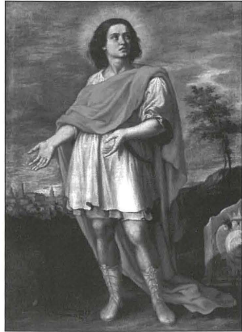
Wieħed mill-kwadri miżmuma fil-mużew ewlieni ta' Macerata.

Għaldaqstant irrinunzja għall-kaċċa, mar lura d-dar, sellem rispettożament il-ġenituri, wriehom kemm felaħ l-affett filjali u l-gratitudni kbira li kellu lejhom, u jum fost l-oħrajn qam u telaq bil-moħbi biex ma jiksrihomx qalbhom. 21 Ġiljan iħalli l-bejta fejn twieled u trabba, u lebbet lil hinn saħansitra mill-konfini ta' art twelidu, biex mar jivvjagga f'reġjuni mbiegħda. Kien dejjem ifittex postijiet imwarrba, fittex li jinqata' għalkollox mill-ħajja soċjali u beda jgħix ħajja ta' talb, ta' meditazzjoni u ta' penitenza. Minn żmien għal żmien kien jieqaf f'xi belt jew f'xi kastell biex isib ftit neċessitajiet tal-ħajja, izda l-iktar li kien ifittex kienu l-bżonnijiet tar-ruħ.