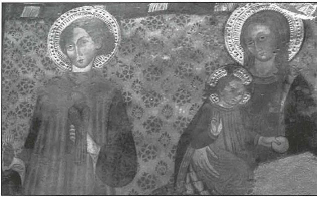
Pittura misjuba waqt restawr li sar fil-Knisja ta' San Giovanni alla Rocca San Zenone fil-periferija ta' Terni. L-istudju għadu għaddej fuqha u l-figura maskili hemm min iġid li hi ta' San Bavone. Iżda dan studju tal-ikonografija kkonfermaw li l-figura hi fil-fatt ta' San Ġiljan Ospitalier.

kwazi deċiż li jobdi din it-tentazzjoni malinna li aġitatu qatigh, għieh li jikkonsulta kif kien xieraq ma' martu, u mar għandha biex jikseb l-approvazzjoni u jdaħħalha kompliċi f'dan l-infantiċidju.