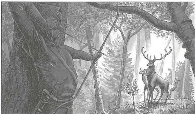
Ix-xena ċentrali ta' San Ġiljan jimmira l-vleġġa fuq iċ-ċerv li jkellmu u jwiddbu. Kif insibu f'xi wħud mir-rakkonti, hawnhekk jidhru wkoll iċ-ċerva omm u l-ferħ tagħha fl-isfond. Il-pittura hija sspirata mir-rakkont ta' Flaubert.

B'dan il-mod hija kienet tidher fir-realtà bħal eżempju ħaj u jtkellem għall-miżżewġin kollha, għall-ommijiet tal-familji, u b'hekk kienet issir aktar maħbuba mill-qalb ta' żewġha Ġiljan, li kien ta' sikwit jiftakar il-kliem ta' Salamun fil-Ktieb tal-Proverbji: "Min sab mara tajba, sab teżor."