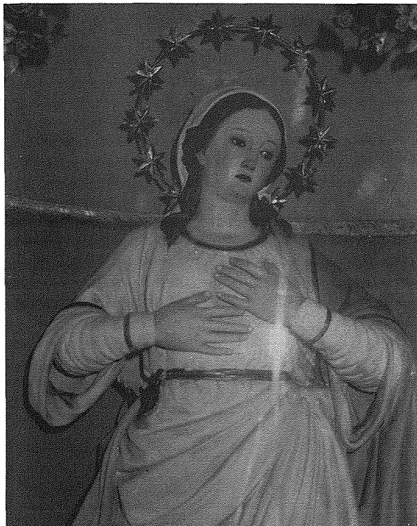
L-istatwa tal-Kunċizzjoni tal-Birgu.