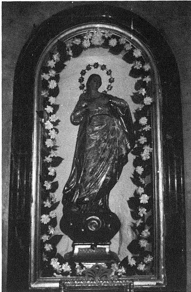
L-istatwa tal-Kuncizzjoni Ta' Ġiesu 'l Belt.

Kienet xena kommoventi fejn ir-Regina tas-Sema ltaqgħet wiċċ imbwiċċ mar-Regina ta' l-Art.