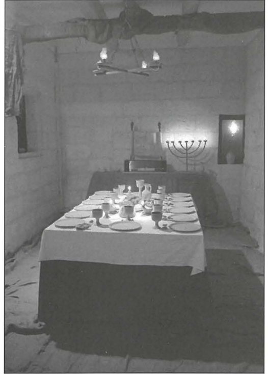
Il-mejda tal-appostli fil-wirja li kienet tkun organizzata mill-Qasam fil-ġranet tal-Ġimgħa Mqaddsa