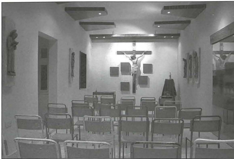
Il-kappella fid-dar rinovata tal-M.U.S.E.U.M

għamel xogħol ta' rinnovament fil-Qasam u għadu jmexxi 'l quddiem l-attività ta' kuljum f'dan il-Qasam tas-Socjeta' li qatt ma kien faċli iżda dejjem kien apprezzat minn kull min miss miegħu. Grazzi lis-Sinjur Alla għal dan kollu, u nitolbu jbierek lill-Qasam tal-M.U.S.E.U.M. f'San Ġiljan li dejjem jibqa' għal qalbi u għal qalbna.