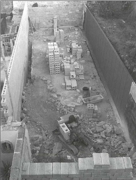
Ix-xogħlijiet fuq il-bini tas-sala l-ġdida

waqt il-premjazzjoni. Fil-Milied tal-1997, id-drammi ittella' ukoll qabel il-Quddiesa ta' nofsillejl fil-Parroċċa quddiem mijiet ta' nies. L-istess gara fis-snin ta' wara. Fil-festa ta' San Ġiljan, il-Qasam tal-M.U.S.E.U.M. ukoll beda jinħass bis-sehem tiegħu f'jum it-tfal u fit-tiżjin sabiħ li beda jagħmel mal-faċċata tad-dar fi Triq Lapsi.