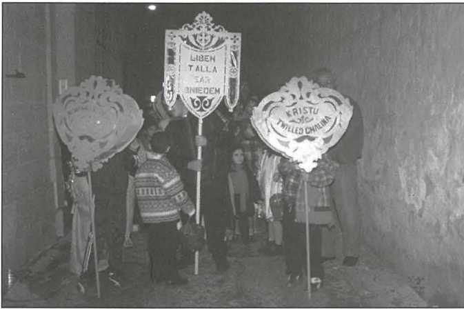
Il-purċissjoni bil-Bambin, organizzata mill-Qasam tal-M.U.S.E.U.M., għaddejja minn Triq Sant'Anġlu

joqgħod l-Imsida u beda jattendi fil-Qasam t'hemmhekk. Minfloku ma ntbagħat ħadd fil-Qasam ta' San Ġiljan. Fl-aħħar tas-snin sebgħin, il-Qasam reġa' għadda minn perjodi twal b'nuqqas kbir ta' tfal.