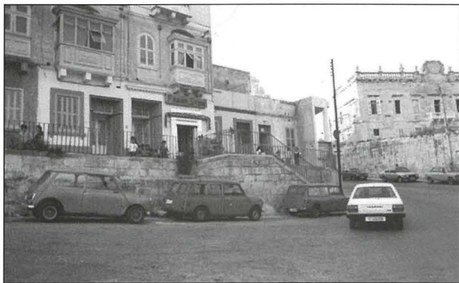
Id-dar numru 65 fi Triq Mensija, li kienet isservi ta' sede għall-Qasam tas-Socjetà tad-Duttrina Nisranija f'San Ġiljan.