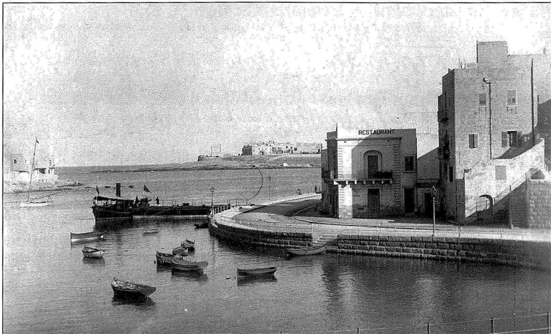
Il-Bajja ta' Spinola fil-bidu tas-Seklu XX. Jidher il-moll li ntrama għas-servizz tal-lanċa u wisq probabbli l-istess restaurant imsemmi fl-artiklu – il-Queen's Cup Restaurant.