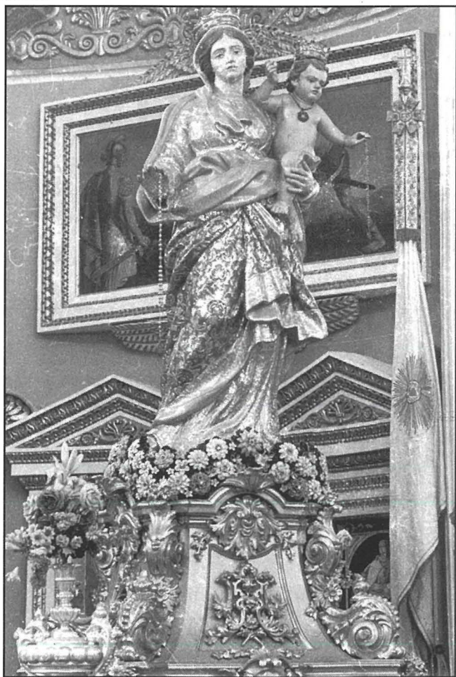
L-istatwa tal-Madonna tar-Rużarju li kienet toħroġ fil-purċissjoni ta' l-Assunta qabel l-1868.

Sa l-1868 fil-Mosta ma kienx hemm l-istatwa ta' l-Assunta. Fil-purċissjoni kienet toħroġ il-vara magħrufa bħala tar-'Rużarju'. Għadha teżisti, vara barokka mill-