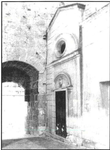
Il-kappella antika tan-Natività, li tinsab f'Sant Anġlu. Kienet iddedikata lill-Madonna mill-Konti Ruġġieru.

lejn is-snin 869-870, it-twemmin Nisrani batta mhux ftit, kif jixhed in-nuqqas ta' hjiel ta' knejjes, statwi, oqbra, pittura jew xi forom ohra ta' wirt arkeoloġiku jew kulturali Nisrani f'dawk iż-żminijiet. Kien biss mal-miġja tal-Konti Ruġġieru fl-1090 u partikolarment mal-waqgħa għal kollox ta' gżiritna f'idejn in-Normanni fl-1127 li l-Kristjaneżmu