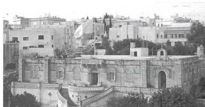
Il-Kunvent mibni mill-ġdid