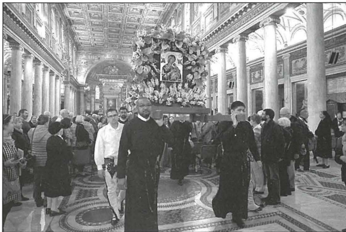
Purċissjoni li saret f'April li għadda mill-Bazilika ta' Santa Maria Maggiore sal-Knisja ta' San Alfons, biex tfakkar il-150 sena ta' qima lejn il-Madonna tas-Sokkors fl-istess knisja f'Via Merulana, Ruma.

jaqagħlu minn saqajh. Ommu tipprova tikkunslah. Hi trid tgħin lilna wkoll. Fuq ix-xellug jidher irrappreżentat San Mikiel, qed iżomm il-lanza u l-isponża tal-passjoni, waqt li fuq il-lemin jidher San Gabriel qed iżomm is-salib papali (salib bi tliet staffi waħda iqsar mill-oħra hekk kif titla 'l fuq). Il-Vergni Marija għandha kewkba fuq għbinha, simbolu tal-irwol tagħha bħala l-kewkba tal-baħar ( Stella Maris ). Xbiehat Biżantini tal-Imqaddsa Vergni Marija juru tliet stilel, tnejn fuq kull spalla rispettivament u oħra fuq għbin il-Madonna. Din it-tip ta' ikona hija msejha ' Hodegetria ', fejn Marija qed turina lil binha, magħruf bħala ' t-Theotokos tal-Passjoni'. L-immieher twil u rqajjaq, xuftejn irraq, u huġbejn lixxi f'forma ta' ark huma mpittra fit-tradizzjoni Biżantina. Il-velu u wiċċha huma wkoll impittra għat-tond, prattikament f'ċirku, sabiex jirriflettu l-qdusija tagħha. Il-kobor tal-figura ta' Ġesù Bambin mhuwiex proporzjonat mal-kobor tal-Madonna. Dan huwa intenzjonat: l-artist xtaq jagħmel enfasi fuq il-Madonna. Ir-raġġiera jew awreola ta' madwar rasha hija fl-istil magħruf bħala ' estofado ', li huwa effett artistiku magħmul permezz ta' toqob fl-ikona sabiex jirriflettu d-dawl mill-isfond dehbi.