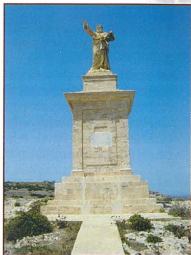
San Pawl tal-Gzejjer

■ Malta tagħna biss, fost il-postijiet b'dan l-isem, għandha tradizzjoni li tintrabat ma' postijiet li jfakkru f'San Pawl. Jeżistu l-Gzejjer ta' San Pawl, f'San Pawl il-Baħar, li jitqiesu qrib il-post tan-nawfragju. Fl-istess raħal, Għajn Rażul hi nixxiegha li magħha jintrabtu rakkonti legġendarji. Jiġi rrakkuntat li hemm, qrib ix-Xemxija, San Pawl ħareġ l-ilma mill-blat, u bih għammed lill-ewwel Maltin li saru nsara. San Pawl Milqgħi f'Burmarrad ta' Ilum, tqies bħala l-post fejn l-appostlu u dawk li kienu miegħu ġew milqugħin mill-prinċep Publiju. In-Naxxar jgħożż it-tradizzjoni li ha ismu għax, lil dawk li ħelsu mill-għarqa, naxrulhom ħwejjigħom. Il-legġenda twassal ukoll li San Pawl, minn Naxxar, instama' jippriedka f'Għaw-