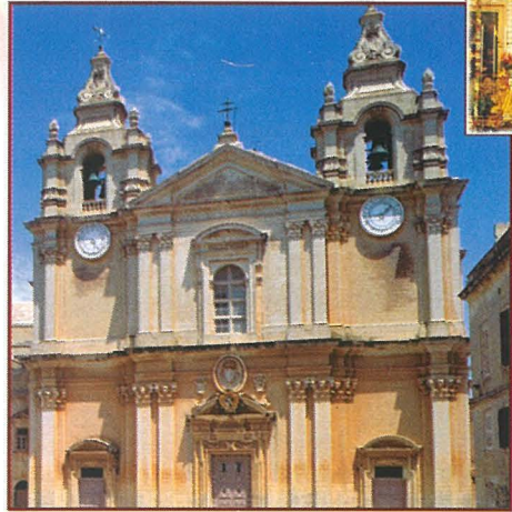
Il-Katidral ta' l-Imdina

F'artijiet fejn il-Maltin emigraw, speċjalment l-Awstralja u l-Amerka, jekk tinbena xi knisja jew issir xi parroċċa li tkun tal-Maltin, l-ewwel ħsieb ikun li jsemmuha għal San Pawl. Festi tiegħu, b'solennità esterna wkoll u b'xi statwa li tinħadem Malta bħal xi waħda li għandna, narawhom f'tant postijiet. F'artijiet ta' emigranti, fejn il-Maltin ikunu mxerrdin 'l hawn u 'l hinn f'xi belt kbira, bħalma hi Londra, is-sacerdoti Maltin jieħdu l-okkażjoni tal-festa ta' l-10 ta' Frar biex jagħmlu stedina lil kull Malti. Huma jlaqqgħuhom biex