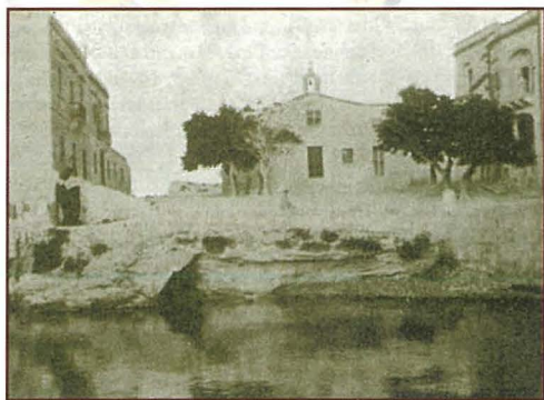
Ritratt antik tal-Kappella ta' San Pawl f'San Pawl il-Baħar

Lil San Pawl, Alla nnifsu bagħtulna fostna biex lill Mulej inħossuh f'ħajjitna u nwassluh lill-oħrajn. Għalhekk, hu xieraq li ntemmu b'xi silta mill-messaġġ ta' San Pawl għad-dinja ta' żmien u għal dik ta' kull żmien. Hu jurina fuq kolloxx li nistrani li jħobb lil Kristu ma jistax ma jħobbx lill-oħrajn, u jersaq lejhom fil-bżonnijiet tagħhom. Ħajtu waħedha hi xhieda biżżejjed biex turi kemm għal Kristu San Pawl ħalla kolloxx. Ħsieb ieħor ma' dawk li diġà tfakkru jkompli jgħinna biex nammiraw lil dak il-bniedem straordinarju.