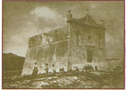
San Pawl Milqgħi f'Burmarrad fl-antik

De Piro. F'din is-Socjetà, ir-rabta ma' San Pawl hi doppja. L-ewwelnett, San Pawl hu patrun tagħha għax imwaqqfa f'Malta li mill-Appostlu ddawlet għall-ewwel darba bit-tagħlim ta' Kristu. It-tieni, għaliex bħal San Pawl, is-Socjetà għandha l-ħegga li twassal it-tagħlim ta' Kristu fost il-ġnus. Żgur li kulfejn huma jmorru jieħdu magħhom l-isem ta' San Pawl u ta' Malta.