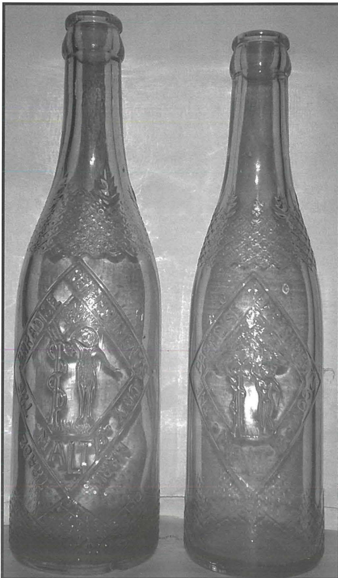
Fliexken tal-bidu, fejn tidher l-emblema tad-ditta Paradise ibbuzzata fil-ħgieġ: Eva taqta' l-frotta mis-siġra

Minbarra l-inbid u l-luminata li l-azjenda Paradise kienet tipproduċi u l-birra Ġermaniża li kienet timporta minn Dortmund, kienet ukoll liċenzjata timla maskta