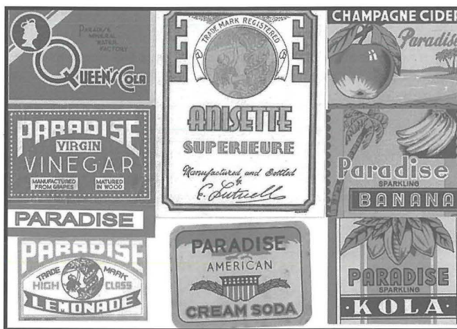
Xi tikketti li kienu jitwaħħlu bl-idejn fuq il-fliexken

Bosta drabi l-ħaddiema rġiel kienu jgħabbu t-trakkijiet għal-lest minn filgħaxija biex filgħodu kienu jsibuhom lesti u jtilqu bihom kmieni, u hekk ma jahlux dik is-siegha, siegha u nofs ta' filgħodu. Kont tara trakkijiet shaħ sejrin lejn il-Birgu, Bormla, l-Isla, Tas-Sliema, San Ġiljan, iż-Żurrieq u Ħaż-Żabbar, fost lokalitajiet oħra. Ġieli l-kaxxi kienu jaqgħulhom fit-triq, l-aktar f'xi telgħa wieqfa, għaliex il-ħaddiema kienu jkunu għabbewhom fil-għoli wisq, jew għaliex ma kinux ikunu rabtuhom sew bil-ħbula. Dil-biċċa inkwiet ma kinitx rari, minbarra li kienet ukoll biċċa wġiġħ ta' ras kbir. Kien ikollok tiġbor il-fliexken imkissrin mill-art f'nofs ta' triq, terġa' tgħabbi l-kaxxi fuq it-trakk, imbagħad tmur lura lejn Ħal Safi fejn kien ikollok toqgħod tispjega għaliex il-kaxxi waqgħulek. Imma kien ikun dejjem mument ta' sodisfazzjon, meta kont tara t-trakkijiet mgħobbija kull filgħodu sejrin lejn id-destinazzjonijiet tagħhom, prodott ta' tant sigħat, anzi granet, ta' xogħol.