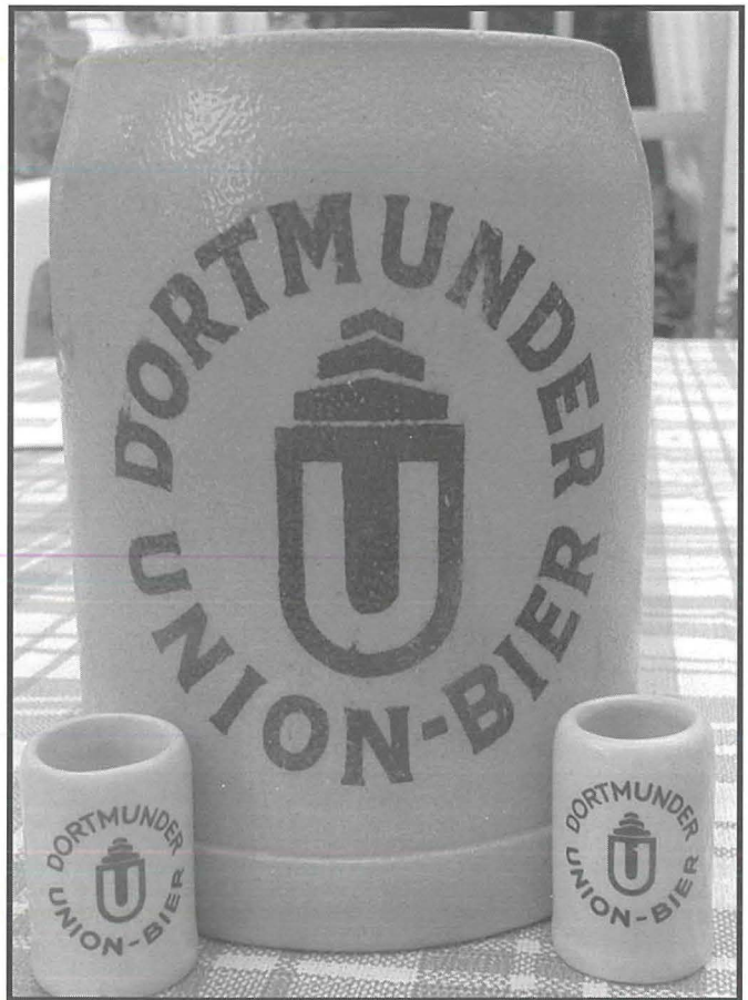
Il-mugs, żgħar u kbar, li d-ditta Dortmund Bier kienet tibgħat mill-Ġermanja biex jitqassmu bħala reklam. It-tfal konna ningibdu lejn il-mugs iż-żgħar. Konna nimlewhom bl-inbid u nixorbuh minnhom, biex nimitaw 'il-kbar. U spiss konna nħossuna fis-sakra; jew nistħajlu li konna

Kif kont irrakkontajt fil-magazine tal-festa ta' snin ilu, din tal-karru tal-karnival għal daqsxejn ma spicċatx ħazin. Dan għaliex il-karru ħadd ma kienet ġietu f'moħħu jirreġistrah mal-organizzaturi tal-karnival ta' dik is-sena. Għalhekk il-pulizija kienu ġew mitluba jarrestaw lil dawk li kienu fuqu. Sakemm xi ħadd rasu fuq għonqu minnhom irrealizza li dawk ta' fuq il-karru ma kienu ħadd għajr erba' bċieċen li minnhom ħadd ma kien għaddielu minn moħħu li biex tghaddi siegħa jew tnejn iddur mat-toroq tal-Belt Valletta, waqt li forsi tiżżufjetta wkoll xi ftit, kellek titlob permess. Piju ta' Marċjol, Ċikku ta'