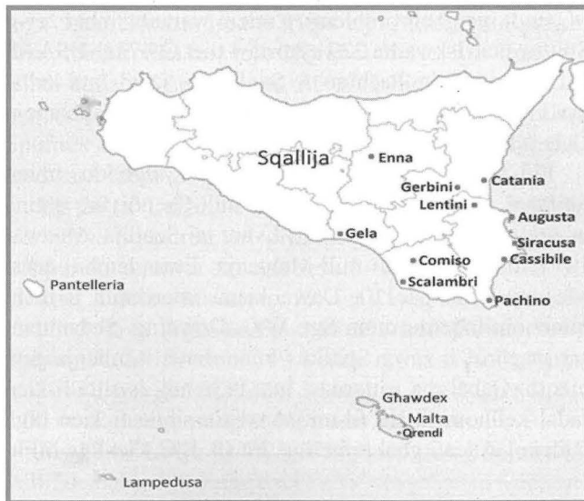
Mappa taż-żona involuta mill-iSpitfires tal-Qrendi

F'dan l-artiklu ser nagħti ħarsa kronoloġika ta' x'uħud mill-avvenimenti l-iktar importanti konnessi mal-mitjar tal-Qrendi matul din l-invażjoni.