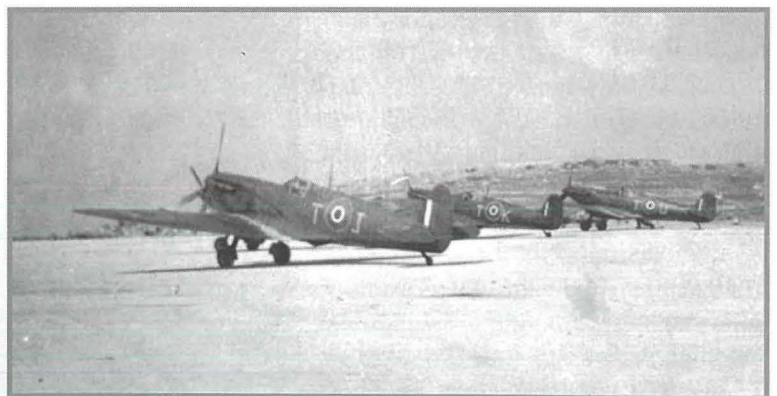
Spitfires tal-Iskwadra 249 ġewwa Ta' Qali

11 ta' Lulju fis-2:15 ta' waranofsinhar taru mill-Qrendi tmien Spitfires mill-Iskwadri 249 biex jipprovdur għassa straordinarja fuq l-inħawi ta' madwar Gela u Scalambri u għassa fuq it-tbaħħir fuq il-kosta ta' n-naħa t'isfel ta' Sqallija. F'dan il-jum Squadron Leader John J Lynch tal-Iskwadra 249 kien ingħata l-unur ta' DFC u BAR b'effett mit-12 ta' Ġunju 1943. Tmien Spitfires mill-Iskwadra 229 waqt li kienu fuq rutina ta' sorveljanza fl-inħawi ta' Comiso interċettaw xi ajruplani tal-għadu b'wieħed minnhom MC202 tar-Regia Aeronautica kien meqrud