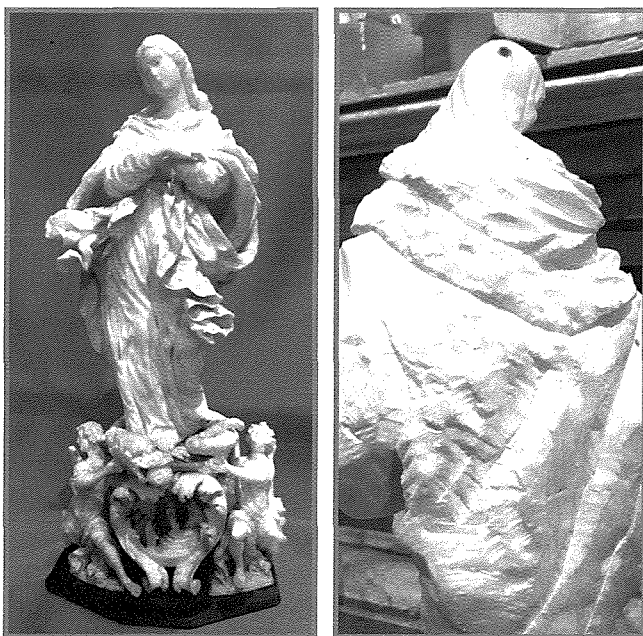
Il-Kunċizzjoni tal-Qrendi u Dettal minn wara turi d-daqqiet tal-ghodda li nħadmet l-istatwa