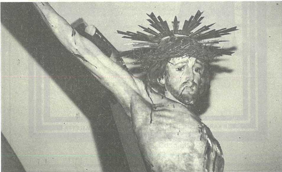
L-espressjoni fuq wiċċ il-Kurċifiss tal-vara l-kbira.