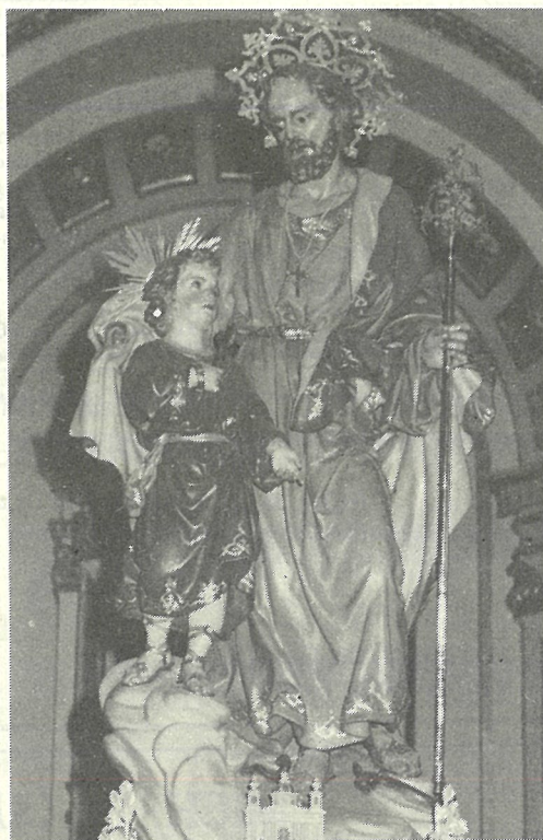
L-istatwa artistika ta' San Ġużepp (injam).

L-iktar knisja li għandħa xogħlijiet ta' Abram żġur li ħija l-Knisja Kolleġġjata ta' Bormla. Ta' min isemmi d-disinj tal-bičča l-kbira tal-ventartali tal-fidda, fostħom dak ta' San Mark li ħuwa kkunsidrat bħala l-Kapolavur tiegħu. Sbieħ ferm ħuma t-trieħi tal-bellus ta' l-altari; il-gastri tal-korsija; il-kandleri tal-maġġur, l-arkata tal-fidda u l-purtiera tal-kwadru tal-kor, u l-messali kollħa tal-fidda, u diversi affarijiet oħra, kollħa ddisinjati minn Abram, fostħom il-bičča l-kbira tad-dekorazzjoni tas-saqaf tal-Knisja u l-famuża mazza tal-Kapitlu. 14