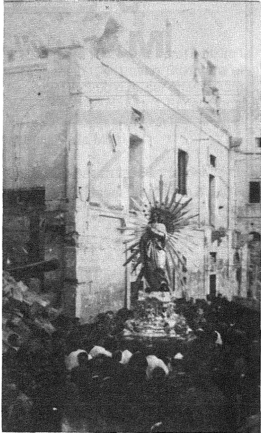
Il-festa wara l-gwerra. L-istatwa għaddejja qalb il-bini mwaqqa'

L-Aħħar ġurnata tan-Novena tkun speċjali. Il-quddiesa tofirog fis-7.00 a.m. Il-Predikatur jagħmel esordju minn fuq il-prespiterju u jispiċċa bl-għajta ta' "Viva l-Immakulata". Wara jkompli jippriedka fuq il-pulptu u jispjega l-istorja kollha tad-Domma tal-Kuncizzjoni, u jispiċċa b'applawż kbir minn kulhadd.