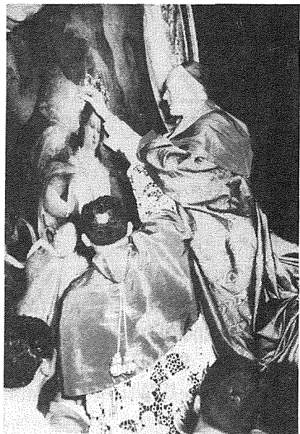
Il-Kardinal Tedeschini jpoġġi l-istllarju madwar ir-ras tal-Madonna 1955,

L-ewwel Sibt, li dejjem jaħbat l-aħħar Sibt ta' Awissu, isir b'sollennità speċjali. Nhar il-Ġimgħa, lejliet l-ewwel Sibt, tindaqq nota sollenni bil-qniepen kollha, u ssir mixegħla fit-triq ta' hdejn il-Knisja. Is-Sibt, wara l-quddies