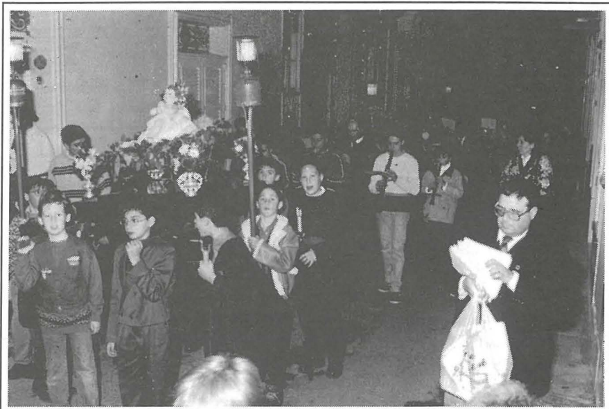
IL-HAMIS, 24 TA' DIĊEMBRU, 1998. Bandisti voluntieri mill-Banda San Ġorġ waqt il-purċissjoni bl-istatwa tal-Bambin Gesù flimkien mat-tfal subien u bniet tas-Sočjetà tal-M.U.S.E.U.M. li dis-sena 1999 qed jiċċelebra għeluq id-90 sena mit-twaqqif fil-Belt Cospicua.

Ġdid, il-Gudja u oqsma ohra. Għall-habta ta' l-1930 kien hemm 24 soċju fil-Qasam.