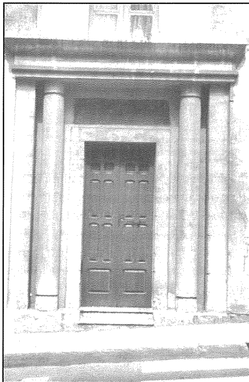
Il-faċċata tal-kappella li tinsab Triq l-Inkurunazzjoni.

Meta nbeda x-xogħol fuq il-bini tas-swar ta' Santa Margerita, wiċċ il-wied ġie mirdum u mgholli diversi metri biex tkun tista' tinbena triq ġdida, b'konsegwenza li din il-kappella sabet ruhha taht it-triq. Jista' jagħti l-każ li għal xi żmien kien hemm xi aċċess għaliha, iżda meta fl-