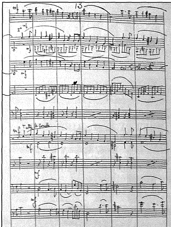
Paġna mill-partitura Fantasia Maltesina

Kummenti oħra jistgħu jitqiesu bħala sintezi ta' dak li għedna dwar dan il-kompożitur influwenti: "Carmelo Pace... ikkontibwixxa bis-siħ fil-hajja mużikali Maltija... Ma fittex xejn għajr l-imhabba lejn xogħlu ( The Sunday Times