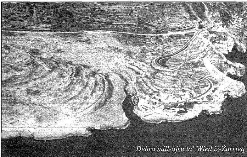
Dehra mill-ajru ta' Wied iż-Żurrieq

Għalkemm din l-invasjoni qatt ma sehhet, hu mifhum minn kwartieri għoljin tas-servizzi, illi kieku din saret, ma tantx kienet haġa faċli li kienet se tirnexxi, billi fl-operazzjoni ta' Kreta li fuqha kienet se titmexxa, l-kundizzjonijiet kienu differenti u ċ-ċansijiet kienu juru li kienet se tkun diżastruża għall-ghadu. Lejn l-aħħar ta' l-1942, wara s-suċċessi ta' Operation Pedestal u convoys ohra, kif ukoll minħabba li l-provvisti kienu żdiedu f'kemm dak li hu fuel għall- ispitfires , bombers u proviżjon għall-kanuni, il-hsieb ta' din l-operazzjoni sfuma fix-xejn. L-invasjoni ta' Sqallija minn Malta nehħiet kull tama ċkejna li seta' kien baqa'.