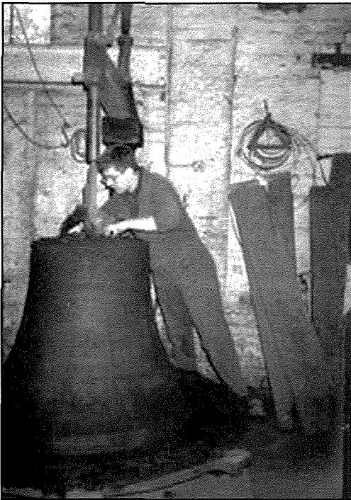
Il-qniepen mill-funderija sal-kampnar – Ritratti mill-1998