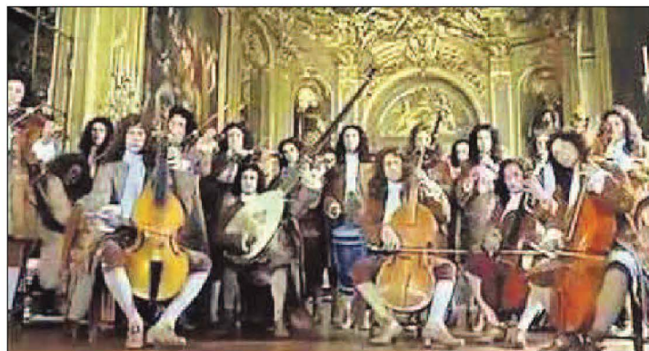
Orkestra bi strumenti varji bħalma kienet l-Orchestre du Roi Soleil taht il-kompożitur Franċiż Jean-Baptiste Lully

qodma tal-gzejjer Maltin, meqjus bħala gojjell artistiku. Dari kien jitqiegħed f'post prominenti f'tarf it-triq li tagħti għall-pjazza u li aktarx kien jinxtegħel bit-tazzi taż-żejt. Illum il-ġurnata għandna naraw xi ftit minnhom, fosthom tnejn li jintramaw ir-Rabat, f'Malta, wiehed