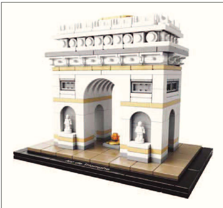
Mudell ta' kif jidher ark trijonfali

Il-marċ trijonfali dlonk ifakkarna fl-ark trijonfali li bħala spiss konna nsibu armati f'diversi bliet u rhula