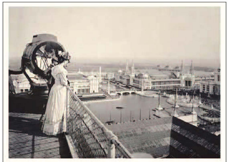
Wahda mill-kartolini li harġu fl-okkażjoni tal-Fiera Dinijija ta' Chicago (1892-3)