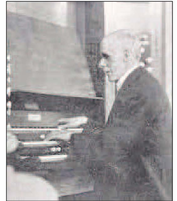
L-organista aghma Inġliż Alfred Hollins