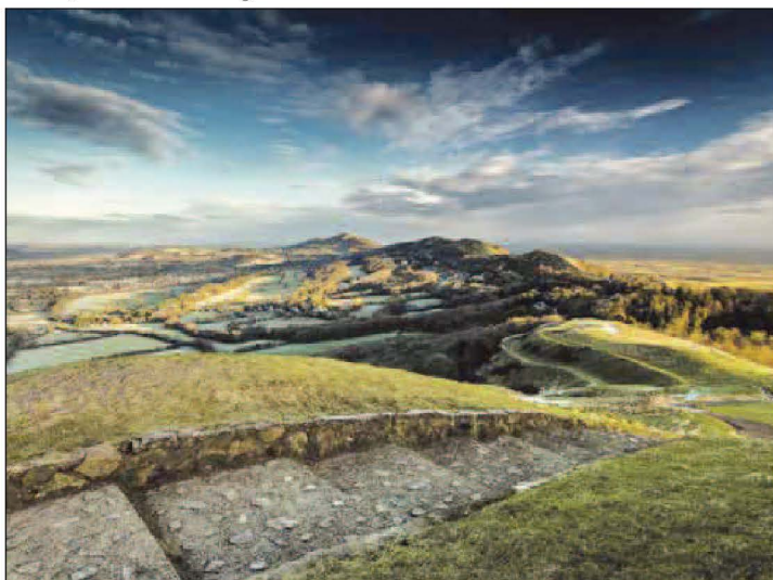
Impressjoni artistika mill-isbah tal-gholjiet ta' Malvern

tinqatagħlu għall-mewt li kieku mhux għax b'diskorsu kkonvinča lill-Imperatur Klawdju. L-ewwel rappreżentazzjoni tal-Kantata f'għieh l-E.T. ir-Reġina Vittorja saret waqt il-festival ta' Leeds fl-1898.