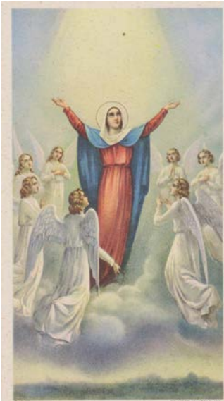
Santa ferm sabiħa tal-Assunta

Legġenda Gudjana: Fiż-żmien Nofsani, ir-rahal tal-Gudja kien jagħmel parti mill-parroċċa ta' Bir Miftuħ, bit-titular tal-parroċċa ddedikat 'il Sta Marija. U peress li l-gzejjer tagħna kienu jiġu spiss attackati mill-furbani, in-nies tal-inħawi qatgħetha li taħbi l-ftit teżori u rikkezzi li dil-knisja kienet mogħnija bihom, fosthom il-qniepen. Jgħidu li dal-oġġetti prezjużi kienu nħbew f'xi bir fil-qrib, iżda meta għadda ftit taż-żmien, hadd ma seta' jiftakar fejn kien eżatt dal-post. Min ħbiehom aktarx li kien safa lsir, bil-konsegwenza li baqgħu qatt ma nstabu sal-ġurnata tal-lum.