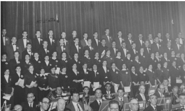
Il-Ħamrun Choir jidhru jkantaw bil-badġe l-ġdida. Magħhom jidhru wkoll xi bandisti mill-Banda Nazzjonali Maltija waqt il-Kuncert tal-Passjoni fir-Radio City Opera House fis-6 t’April, 1957