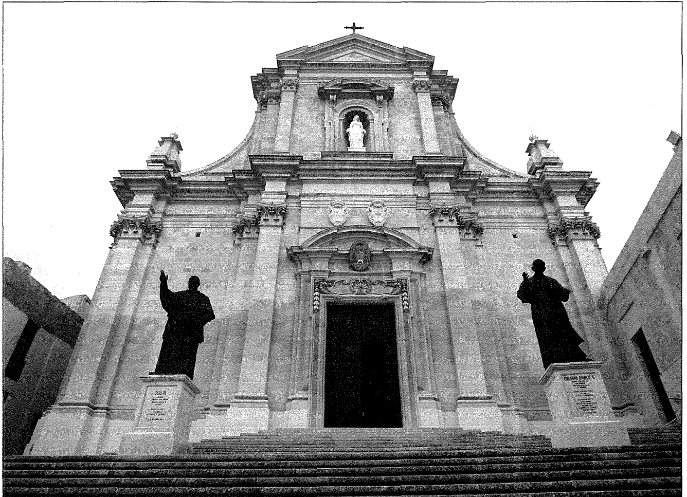
Il-Knisja Matriċi, Kolleġġjata Insinji, u Katidrali ta' Għawdex, iddedikata sa mill-qedem lil Santa Marija Assunta. L-origini ta' din il-parroċċa huma Bizantini u fl-1299 kienet diġà tiffunzjona bhala knisja parrokkjali fil-veru sens tal-kelma.

Bosta huma dawk l-awturi li sejhu lil Għawdex “il-Gżira ta’ Santa Marija”. Dan għaliex sa mill-qedem, l-Għawdxin qiemu lill-Madonna taht dan it-titlu għażiż tal-Assunzjoni tagħha fis-sema. Waħda mill-provi li jixhdu għal dak li qed ngħidu huwa n-numru kbir ta’ knejjes iddedikati lil Santa Marija Assunta li kienu wieqfa f’Għawdex sa mill-ibghad żminijiet, mifruxin mal-erbat irjeh tal-gżira, li allura nistgħu ngħidu li kienu centri ta’ qima Marjana fi żmien meta l-ħajja tal-Għawdxin kienet waħda iebsa u mimlija qtiegħ ta’ qalb. Minn dawn il-knejjes, l-imħabba tal-Għawdxin lejn il-Madonna komplet tissahħah minn żmien għal żmien u l-għozza lejn il-festa tal-Assunzjoni tagħha fis-sema komplet dejjem tikber matul is-snin.