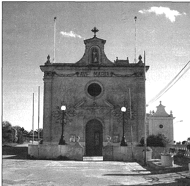
Il-Knisja ta' Santa Marija tal-Qala - illum iddedikata lill-Immakulata Kuncizzjoni.

Bil-mod il-mod Ghawdex beda jistejjer mill-herba li kien garrab fl-1551. U erbgha u għoxrin sena wara seħħet grajja oħra importanti hafna: il-Viżta Apostolika li Mons. Pietru Dusina wettaq fil-gzejjer Maltin fl-1575. F'Ghawdex il-Viżitatur Appostoliku wasal nhar il-Ħadd 13 ta' Frar u baqa' sejjer dritt lejn il-' principalem '