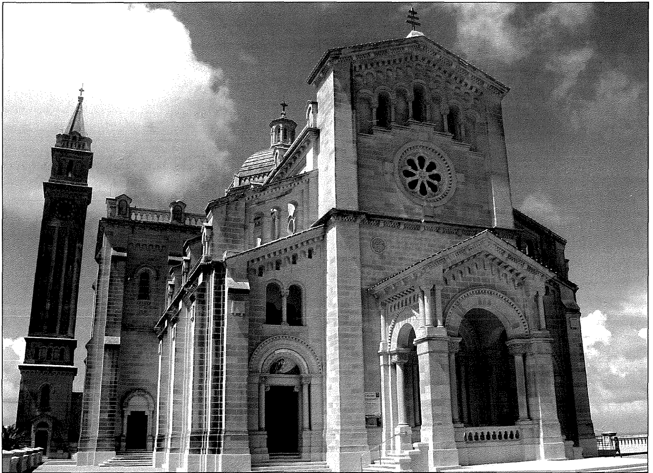
Il-Knisja-Santwarju Nazzjonali ta' Santa Marija ta' Pinu. Fis-seklu 16 din kienet knisja ċkejkna tal-kampanja imsejha Ecclesia ta' Gentile - "il-Knisja ta' Gentile".

insibu li din il-knisja la kellha bieb, la saqaf, u lanqas ebda tiżjin iehor. Mons. Dusina ordna li jsir il-bieb fi żmien xahar. 15