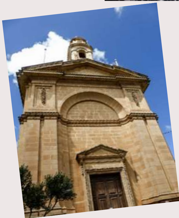
Nadur - Kappella Qalb ta' Ġesu, Ta' Karkanja