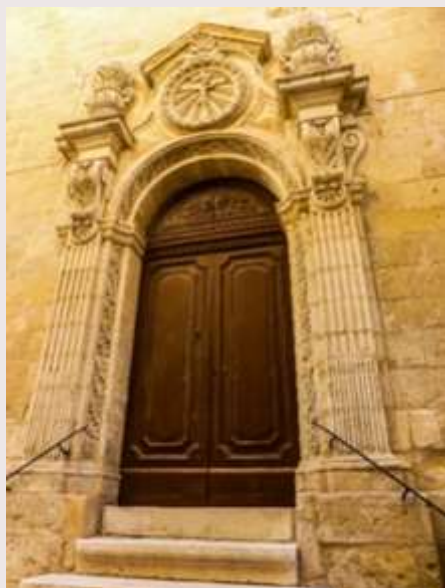
Bormla - Orotorju tal-Kurċifiss