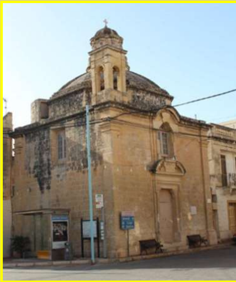
Il-Knisja ta' Santa Katarina li qed tiġi restawrata