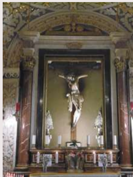
Belt Valletta- Kurċifiss ta' Ġiezu - Orotorju tar-Redentur