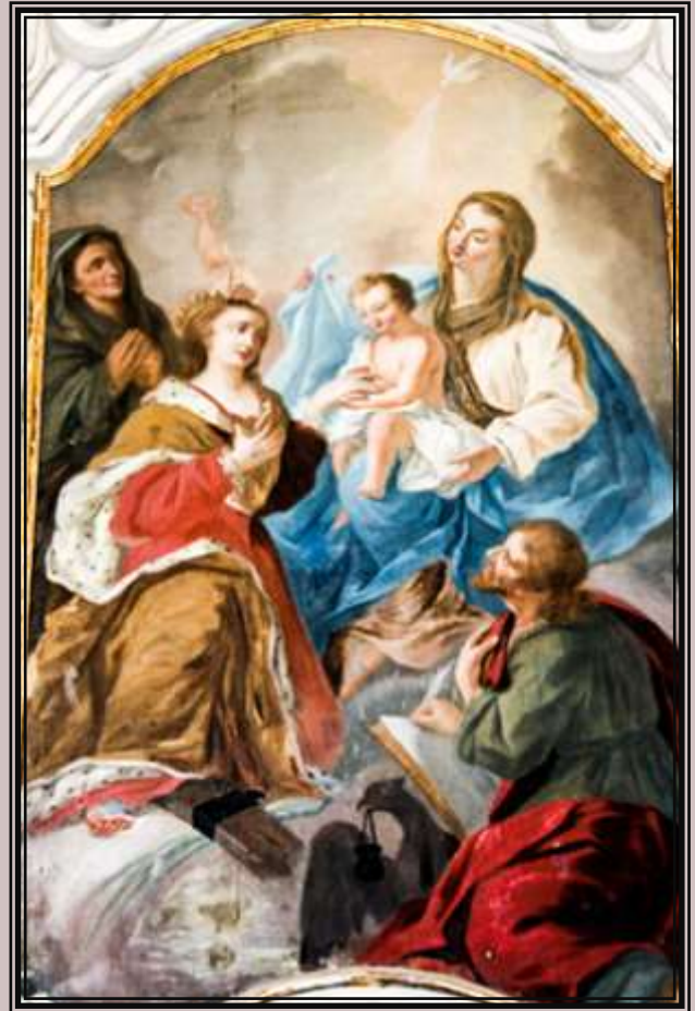
It-Titular li juri ż-żwieġ mistiku ta' Santa Katarina il-Madonna bil-Bambin, San Ġwann l-Evangelista.