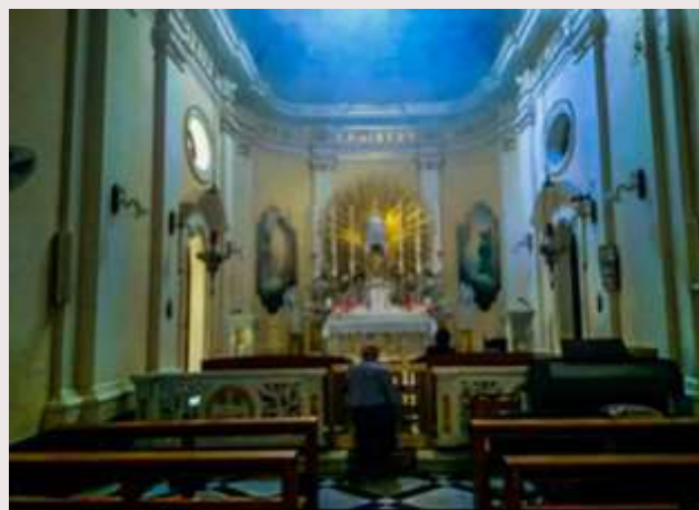
Belt Valletta—Kappella tas-SS Sagrament