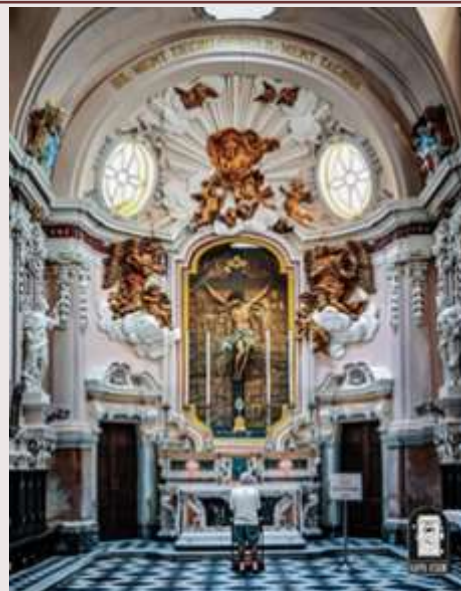
Isla - Orotorju tar-Redentur