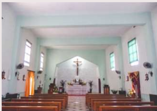
Marsa, Albert Town— Kappella Qalb ta' Ġesu