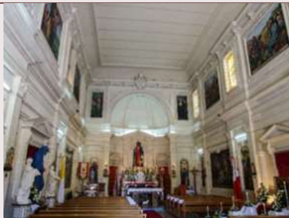
Mosta - Oratorju Qalb ta' Ġesu