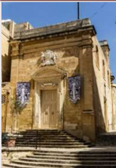
Birgu — Orotorju tal-Kurċifiss