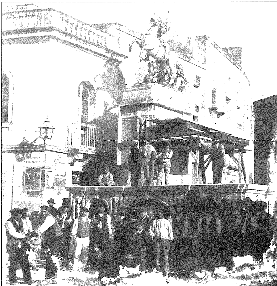
San Ġorġ fuq iż-żiemel armat fil-post originali tiegħu, kantuniera ma' Triq San Frangisk, bħala parti minn palk tal-banda. Ritratt meħud c. 1910.