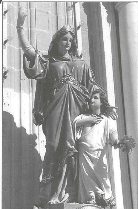
L-istatwa tat-tifel San Ġorg flimkien ma' ommu Polikronia (1894).