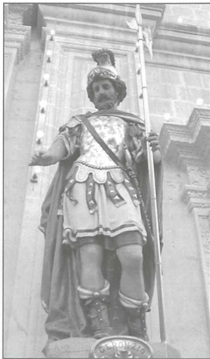
L-istatwa ta' Geronzio, missier San Ġorg (1894)

Differenza oħra li naraw fi Cremona hu l-istil li kien ġeneralment iħaddan. Fi żmienu, is-sentiment Purista kien dominanti iżda Cremona kien jippreferi l-istil psewdo-Barokk bi statwi eżuberanti ibbażati fuq l-importanza ta' ċaqliq u affetti , katatteristiċi li juru l-influwenza li kellu t-teatru fuq ħajtu għax, wara kollox, it-taħriġ primarju tiegħu kien ta' xenografista. Iżda diversi drabi sawwar statwi li qorbu lejn l-idjoma Purista, u dan x'aktarx bħala mezz biex jiġbed lejha kummissjonijiet ta' xogħol.