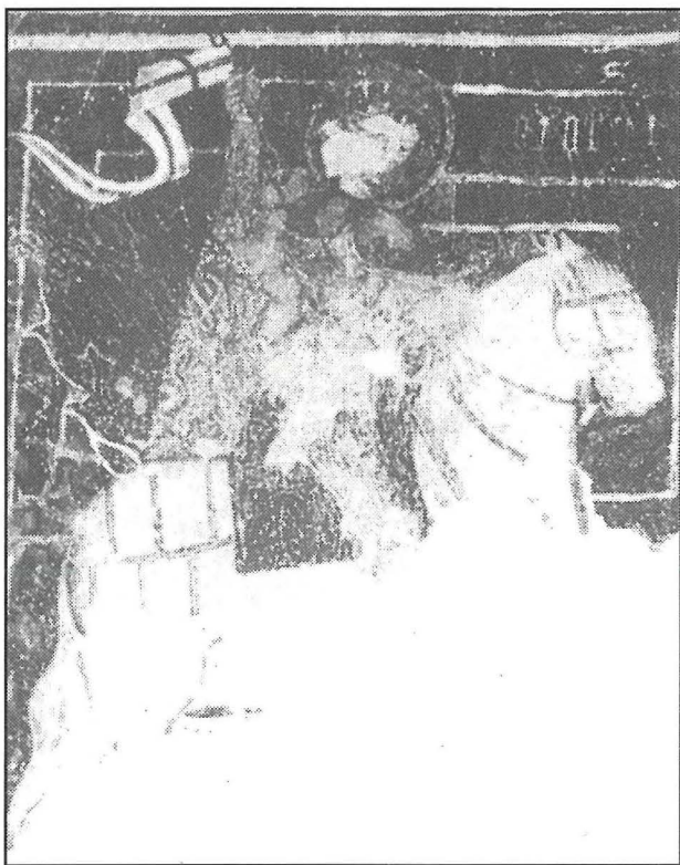
Affresk ta' San Ġorġ fuq ix-xellug tal-bieb inti u diehel.

Kull panew kien xogħol li sar f'jum wieħed ħlief il-panew ta' Sant' Andrija u t-tnejn ta' San Ġorġ li kull wieħed ħa jumejn biex sar. L-artist uża numru limitat ta' kuluri u kiteb l-ismijiet tal-qaddisin f'hejn rashom bil-Latin-Sqalli. Dawn il-qaddisin, inkluż naturalment San Ġorġ, jindikaw tnax-il qaddis li f'Malta kien hawn knejjes dedikati lilhom qabel is-sena 1500 u nżidu li bosta mill-abitanti ta' Hal Millieri ta' dak iż-żmien kellhom ismijiet simili. X'aktarx li dawn il-pitturi thallsu minn xi benefattur għani. Il-pitturi ġew restawrati fil-1974 mill-Professoressa Paola Zanolini.