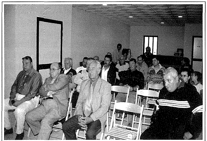
Waqt il-Laqgħa Ġenerali