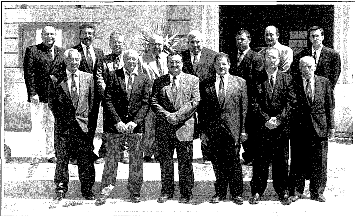
IL-KUMITAT BANDA SAN PAWL