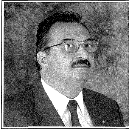
Paul Bugeja l-President li huwa wkoll is-Sindku ta' San Pawl il-Baħar