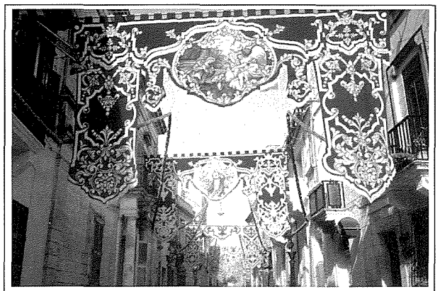
Żewġ pavaljuni godda lesti minn sett ta' għaxar armati fi Triq il-Kbira għal okkażjoni tal-Festa ta' l-Annunzjata