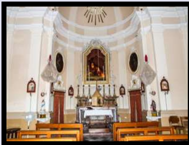
Għaxaq / Gudja— kappella ta' Santu Kristu