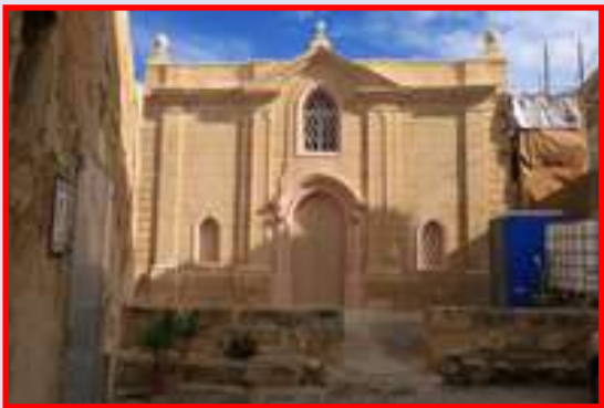
Zejtun — Kappella tas-Salvatur, il-faċċata riċentament restawrata