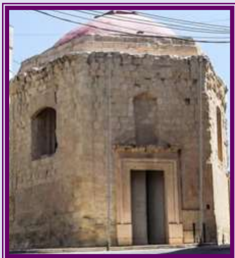
Kalkara — Kappella tat-Trasfigurazzjoni, jew Tas-Salvatur