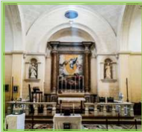
Lija — Kappella tat-Trasfigurazzjoni, jew Tas-Salvatur,