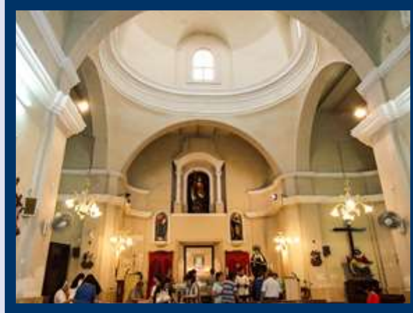
Gzira - Kappella tar-Redentur