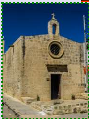
Rabat— Kappella tat- Twelid ta' Ġesu u San