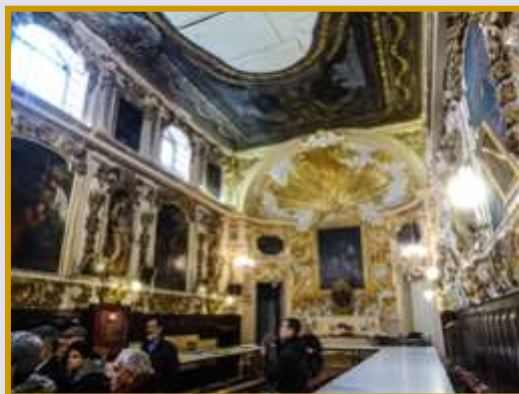
Valletta - Orotorju tas- SS Sagrament, tad — Dumnikani