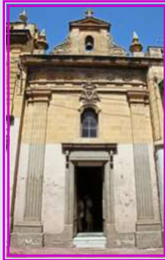
Paola - tan-Nazzarenu