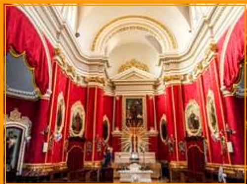
Xagħra, Għawdex - Kappella tar-Redentur