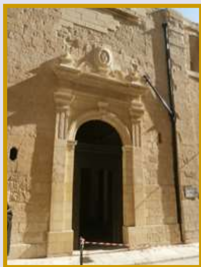
Zejtun - Orotorju tal- Ewkaristija / SS Sagrament