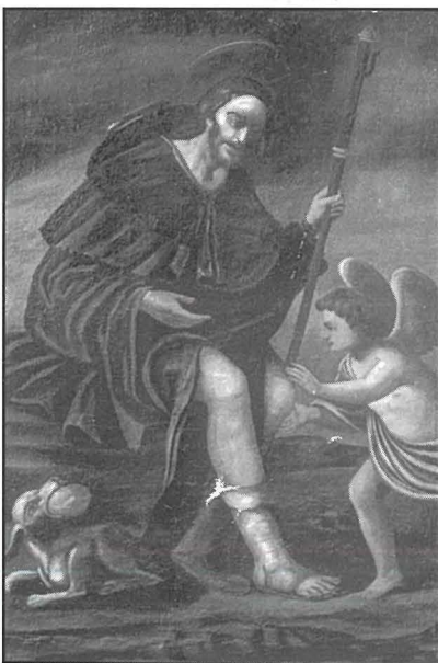
Il-kwadru ta' Santu Rokku