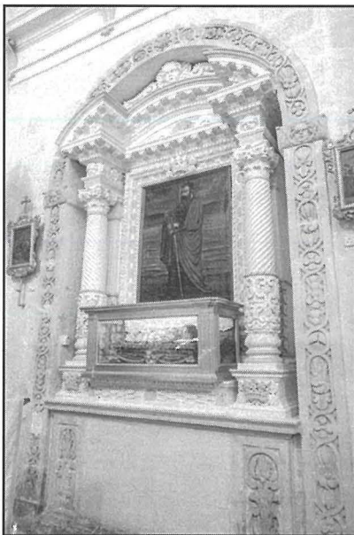
Artal ta' San Pawl