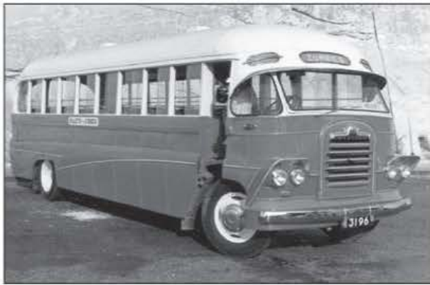
177 it-trakk li kellu l-Billy Boy tal-Marsa u kienet taħdem fuq il-linja ta' Bormla (c 1936)

“Hal Qormi ġewwa”, u jekk xi hadd kien ikun sejjer jirkeb ma’ ta’ Haż-Żebbuġ u jisma’ din l-ġhajta, jerġa’ lura u jirkeb ma’ tas-St Francis.