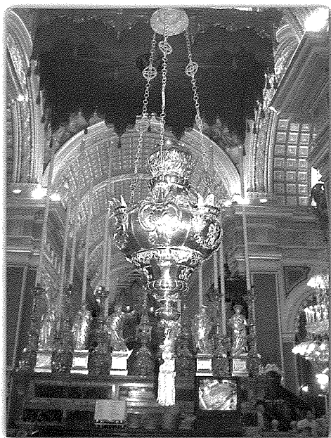
Il-lampier tal-fidda li sar fl-1815