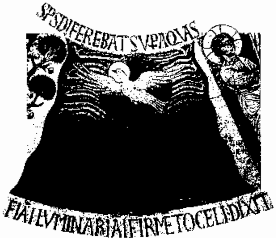
Il-Holqien – "Fuq wiċċ l-ibhra kien jitta jjar l-ispirtu ta' Alla" (Ġen 1,1)