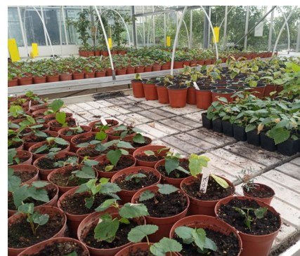
Fig. 4 – Xitel tat-tut fis-serra għall-akklimatizzazzjoni wara t-tkattir bil-mikropropagazzjoni

Bħala konklużjoni ta’ min jgħid illi permezz tal-proċess ta’ mikropropagazzjoni eluf ta’ xitel ħielsa mill-mard jista’ jitzkabbar f’temp ta’ ftit xhur u għalhekk dan ix-xogħol għandu sehem importanti fil-produzzjoni agrikola lokali.