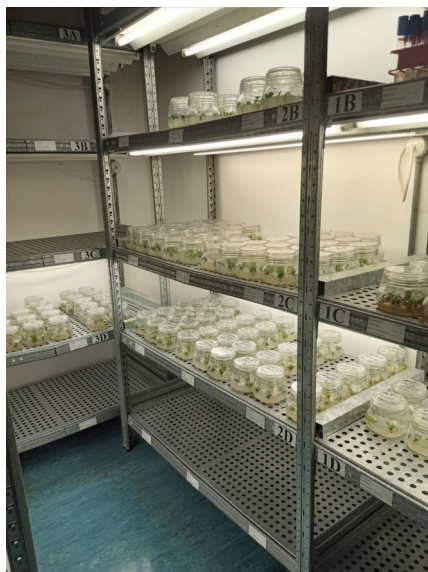
Fig. 3 – Kamra tal-inkubazzjoni f’ambjent ikkontrollat għall-iżvilupp tax-xitel

Konservazzjoni tar-Riżorsi Ġenetiċi, li xogħolha huwa wkoll il-konservazzjoni, ir-riċerka u l-użu ta’ pjanti slavaġ kompatibbli ma’ pjanti agrikoli, dan it-tip ta’ xogħol ser ikompli fis-sinjura li ġejjin, skont il-bżonn, billi jiġi esplorat il-potenzjal agrikolu ta’ dawn l-ispeċi.