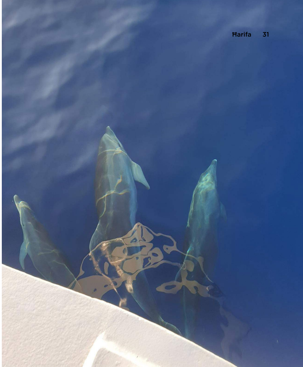
Fig. 1 Ritratt li juri tip ta' interazzjoni bejn sajjied u ċ-ċetaċji. F'dan il-każ ir-ritratt juri l-preżenza ta' Tursiops truncatus , iktar magħruf bħala d-denfil ta' geddumu qasir.

Fil-parti li jmiss tat-tieni fażi, il-fondi tal-Fondazzjoni MAVA ser jintużaw biex jinxtara apparat akustiku, magħruf bħala pingers. Diġà saru diversi studji reġjonali li juru li ċerti pingers kienu ta' suċċess, filwaqt li oħrajn ftit inqas. Wara laqgħa mal-Fondazzjoni MAVA u l-imsieħba tal-proġett,