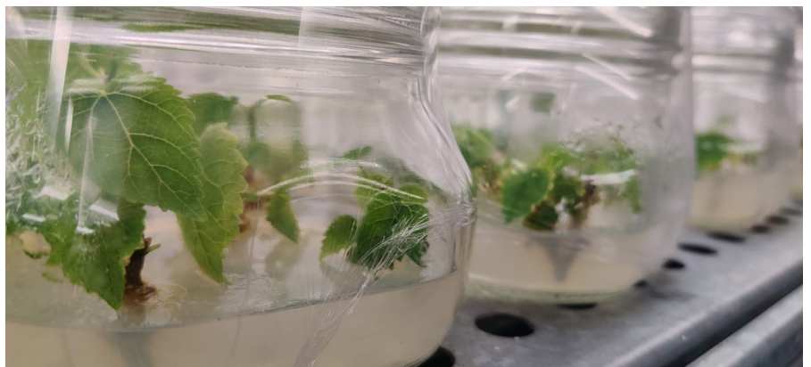
Fig. 2 - Xitel tat-tut f'taħlita li tistimola l-produzzjoni tal-friegħi

Il-laboratorju tal-mikropropagazzjoni jkun involut minn żmien għal żmien f'riċerka fil-konservazzjoni ta' pjanti indigeni, billi jiżviluppa metodi biex dawn il-pjanti jiġu mkattra skont il-ħtieġa. Dan il-proċess huwa t'importanza għal dawk il-pjanti li llum il-ġurnata huma rari fil-gżejjer Maltin, in-numru ta' żrieragħ tagħhom huma ftit wisq, it-tkattir tagħhom b'metodi konvenzjonali huwa pjuttost diffiċli, jew huma mhedda min-ħabba raġunijiet oħra. Għal dan il-għan, matul is-snin saru studji fuq diversi pjanti endemiċi, inkluż is-Sempreviva t'Għawdex u l-Bjanka tal-Irdum. Billi l-laboratorju huwa parti mis-Sezzjoni għall-