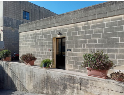
Fig. 1 - Id-dahla tal-laboratorju tal-mikropropagazzjoni tal-pjanti

Il-Laboratorju tal-Mikropropagazzjoni jinstab fi ħdan id-Direttorat għall-Protezzjoni tal-Pjanti ġewwa Haġ Lija.