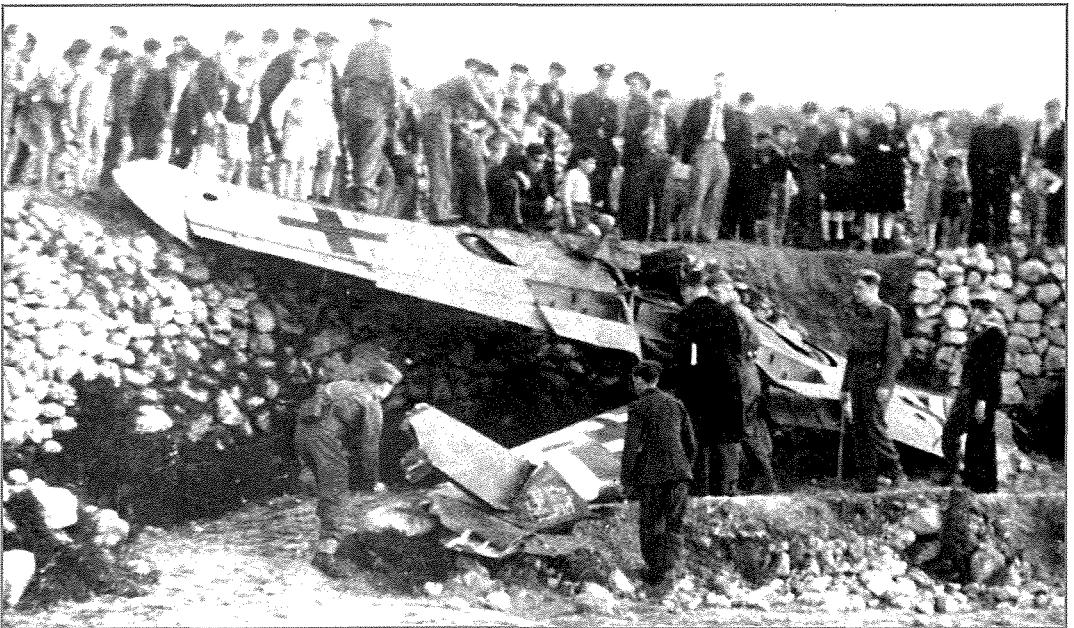
L-10 ta' Mejju hija d-data meta l-Battalja ta' Malta daret favur id-difiża tal-Gżiritna. Ajruplani Germaniżi mfarrkin kienu jidhru kull fejn thares dakinhar, fit-triqat, fl-għelieqi u fuq bini mwaqqa'. Minbarra l-ġlied fl-ajru minn Spitfires tal-Iskwadri Nru 185, 249 u 126, numru ta' ajruplani oħra tal-ghadu twaqqghu ukoll mill-kanuni tal-art.