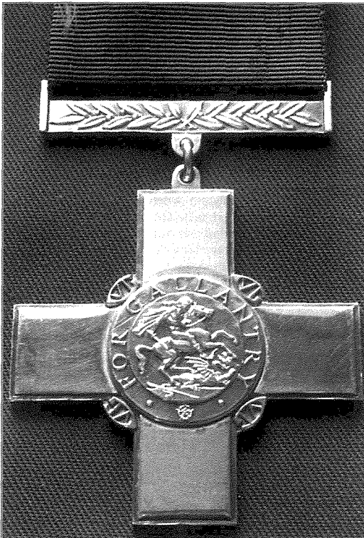
Il-George Cross, li nghata mir-Re Ġorġ VI lill-poplu Malti fil-15 ta' April, 1942.